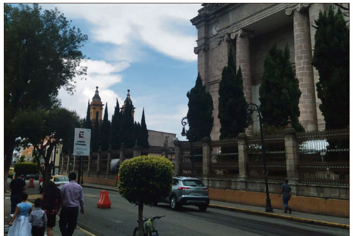
▲El punto de reunión será frente a la Catedral Metropolitana.

Debido a que las festividades se desarrollan justamente en las inmediaciones de Jaltepec, los inconformes amagaron con impedir el evento bajo el grito de “¡No hay feria, no hay feria!”, lo que eleva la tensión y la expectativa en torno a la concentración civil del domingo.