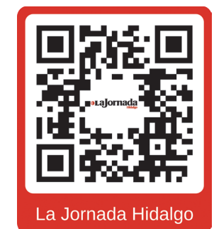
La Jornada Hidalgo