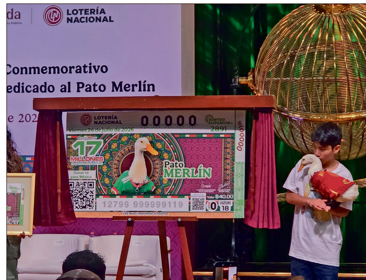
▲ La Lotería Nacional presentó el billete del Sorteo Superior número 2891, con una bolsa de 51 millones de pesos.

La Lotería Nacional informó que circularán 2 millones 400 mil cachitos con la imagen de Merlín para llevar esta historia por cada rincón del país.