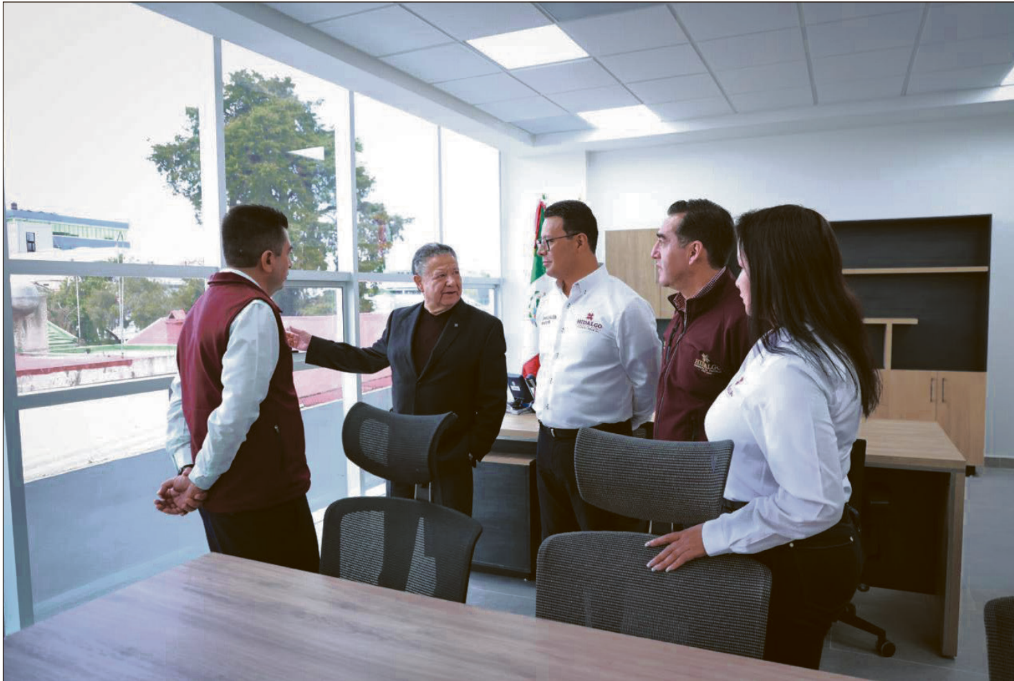
▲ El nuevo complejo de oficinas se ubica en la calle 16 de Enero, en Pachuca, donde antes se encontraba la Casa de Gobierno.

Turismo, Sedeco y STPSH tendrán sede en el inmueble de la calle 16 de Enero