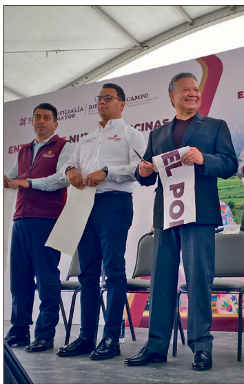
▲ Fueron invertidos más de $377 millones; más de $288 millones fueron para infraestructura.

“Vamos a terminar la administración sin tener que pagar rentas en la Zona Metropolitana de Pachuca. Vamos adelantados con el CASP, que tendrá una inversión por 2 mil 800 millones de pesos. Durante muchos años las administraciones, o quienes la integraban, construían edificios en zonas privilegiadas para