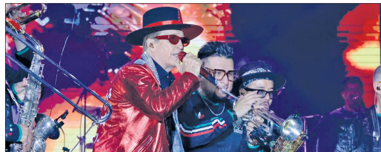
▲ Artistas de talla nacional e internacional, como Emmanuel, hicieron vibrar a miles de asistentes.

“Nuestro objetivo fue ofrecer una feria gratuita, segura y de calidad para las familias, al mismo tiempo que impulsamos el turismo, la economía local y mostramos al mundo la grandeza de Zempoala. Hoy, con la asistencia de miles de personas, confirmamos que nuestro municipio se consolida como un destino único e imperdible para quienes visitan Hidalgo”, destacó.