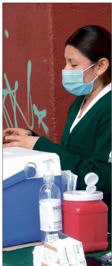
▲ La Secretaría de Salud federal y las brigadas locales de Hidalgo mantienen activos los protocolos de vigilancia.

Las autoridades exhortan a la población a revisar las cartillas de vacunación y acudir a su centro de salud más cercano en caso de detectar síntomas como fiebre alta, tos, escurrimiento nasal y manchas rojas en la piel.