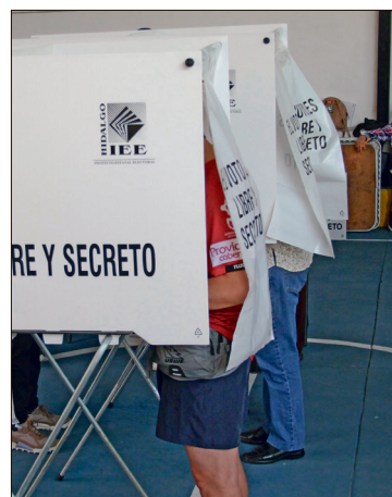
▲ Actualmente, se trabaja en el desarrollo de las elecciones ordinarias.

En 2027 se renovarán diputaciones federales, locales y ayuntamientos