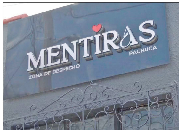
▲ Las clausuras se han realizado en diferentes zonas de la ciudad y no se concentran en un punto específico.

Comentó que la dependencia realiza recorridos permanentes junto con el municipio para supervisar los establecimientos y garantizar la seguridad de la población.