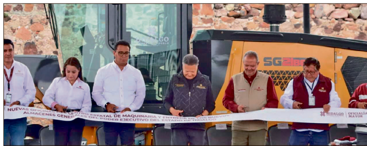
▲ Dentro del equipamiento entregado, destaca la inauguración de los nuevos almacenes del gobierno, un complejo integrado por cinco naves que fue construido con una inversión superior a los 70 millones de pesos.

Este espacio tiene como objetivo principal resguardar, organizar y administrar de manera eficiente todos los bienes adquiridos por las