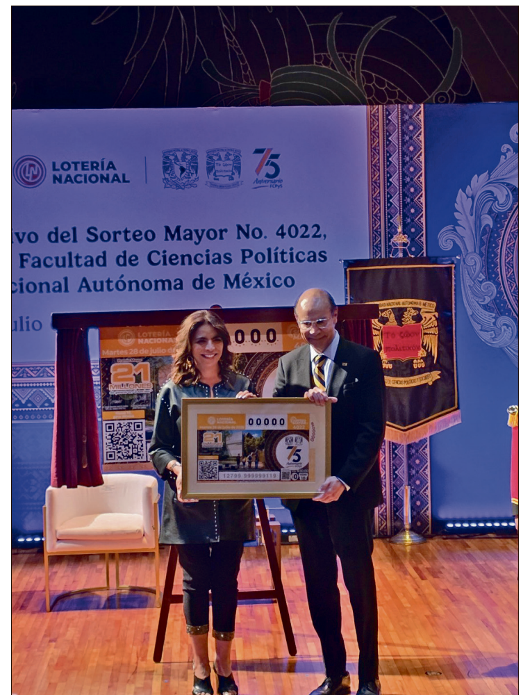
▲ El billete conmemorativo reconoce la formación de profesionales que han contribuido a la vida pública, la academia, la diplomacia y los medios.

En la actualidad, la FCPyS reúne a más de 12 mil estudiantes. Sus autoridades destacaron que la institución ha preparado especialistas que participan en ámbitos estratégicos para el desarrollo nacional.