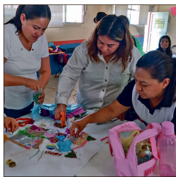
▲ Se presentaron alternativas para diseñar espacios multisensoriales y elaborar materiales didácticos.

Desde la disciplina de las artes visuales, el taller abordó temas relacionados con la creatividad como herramienta pedagógica, la percepción corporal y espacial, así como estrategias para la atención de estudiantes