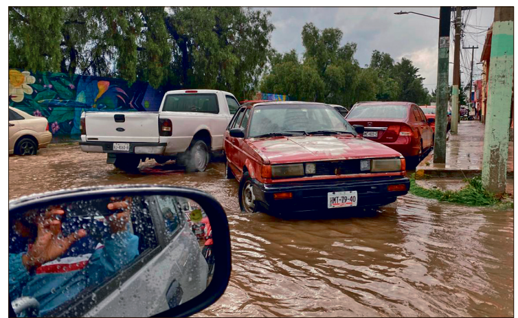
▲ Durante junio de 2026, la entidad registró un volumen de precipitaciones equivalente al 123% de su media histórica.

la entidad. El organismo oficial de Conagua informó que la interacción de dos circulaciones ciclónicas sobre el territorio nacional, canales de baja presión y el avance de ondas tropicales mantendrán condiciones de inestabilidad atmosférica generalizada.