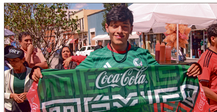
▲ Pachuca y Grupo Rica pusieron en marcha un espacio de activaciones gratuitas que permanecerá abierto hasta el 19 de julio.

Finalmente, destacó que Pachuca ya comenzó a registrar una importante afluencia de visitantes derivada de actividades relacionadas con el fútbol internacional, como la reciente visita de la selección de leyendas de Sudáfrica, cuyos integrantes realizaron diversas actividades turísticas en la ciudad.