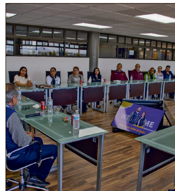
▲ Este logro refleja el trabajo coordinado de la Secretaría de Educación Pública de Hidalgo y de la Subsecretaría de Educación Media Superior y Superior.