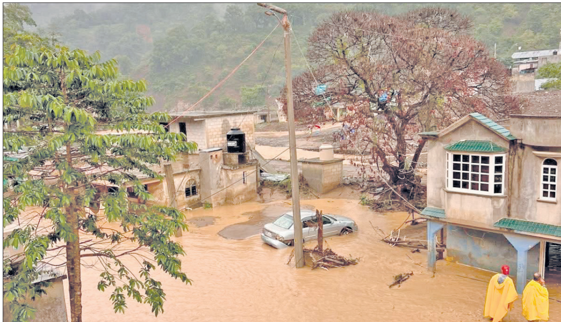
▲ Las lluvias también han provocado daños en infraestructura vial del municipio.

Las lluvias también han provocado daños en infraestructura vial del municipio. El edil informó que dos puentes provisionales, ubicados en Zacatipán y Tenexco, fueron destruidos por la fuerza de las corrientes, mientras que los derrumbes continúan ocasionando