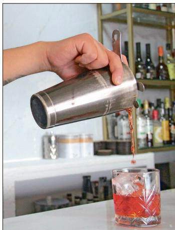
▲ Algunos negocios apostarán por nuevas promociones, bebidas y opciones de coctelería.

La representante del sector explicó que previo al inicio de la justa deportiva sostuvieron reuniones con los afiliados y el Instituto Mexi-