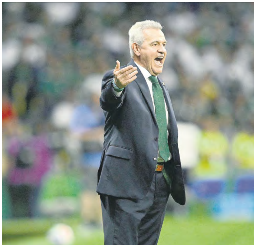
▲ El Vasco ha logrado una primera ronda histórica con el conjunto nacional. El martes tendrán el respaldo de la afición en el estadio Azteca.