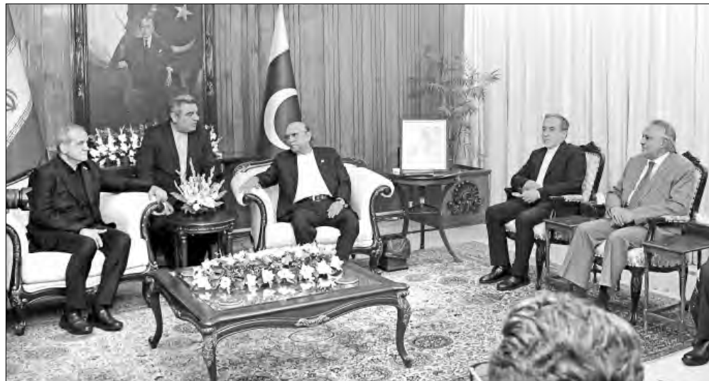
▲ En esta imagen del lunes en Islamabad, el presidente paquistaní, Asif Ali Zardari (al centro), en una reunión con su par de Irán,

http://alfredojalife.com • https://substack.com/@jaliferahme • https://www.patreon.com/alfredojalife • https://www.facebook.com/AlfredoJalife • https://vk.com/alfredojalifeoficial • https://t.me/AJalife • https://www.youtube.com/channel/UCJfxjOTHzDPL_cOLd7psDsw?view_as=subscriber • https://vm.tiktok.com/ZM8KnkKQn/ • https://twitter.com/AlfredoJalife • Instagram: @alfredojalifer