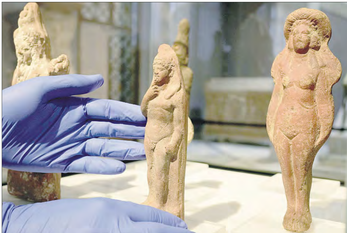
▲ Las autoridades egipcias recuperaron una gran cantidad de artefactos saqueados y descubiertos en el extranjero, por lo que mantienen una campaña internacional de repatriación de bienes identificados como objetos de tráfico ilegal. Gracias a estos

esfuerzos, varias antigüedades fueron devueltas al país africano por el Ministerio de Cultura griego. En la imagen, un restaurador coloca una pieza sobre su base durante una ceremonia de repatriación en el Museo Arqueológico Nacional de Atenas.