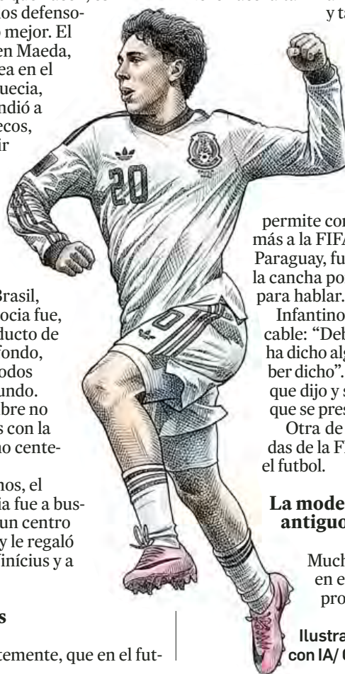
Ilustración elaborada con IA/ Gemini de Google

jugada muy vieja. Tal vez la más antigua de todas: ganar la línea de fondo y centro atrás. Es que, de ese modo, los defensores, generalmente, quedan descolocados y sin poder impedir el tiro al arco. Algunos piensan que lo antiguo es malo y lo moderno bueno ¿qué le vamos a hacer?