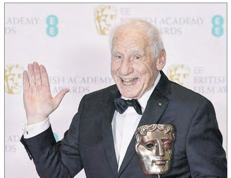
▲ El cineasta estadounidense Mel Brooks durante la ceremonia de los premios Bafta de la Academia Británica de Cine en el Royal Albert Hall de Londres, en 2017.

Aún hoy, Brooks no se ha retirado. En abril, envió un mensaje en video a Eddie Murphy para homenajearlo por su premio AFI a la trayectoria. En mayo, anunció que donaría miles de sus documentos y fotografías al National Comedy Center en Jamestown, Nueva York.