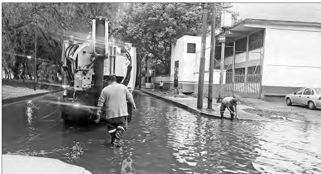
▲ El Heroico Cuerpo de Bomberos acudió al cruce de avenida de las Culturas y Cinematografía, en la colonia El Rosario, alcaldía Azcapotzalco, donde

Los aficionados del fútbol, quienes ya había previsto el mal tiempo y acudieron con sombrillas e impermeables al Zócalo capitalino, sufrieron las consecuencias de las precipitaciones con la suspensión temporal del Fan Fest, cuando a medio partido entre Portugal y Colombia en la enorme pantalla apareció un mensaje en el que se leía: “Por razones de seguridad, el evento se suspenderá de manera temporal”. No obstante, la transmisión se reanudó minutos después.