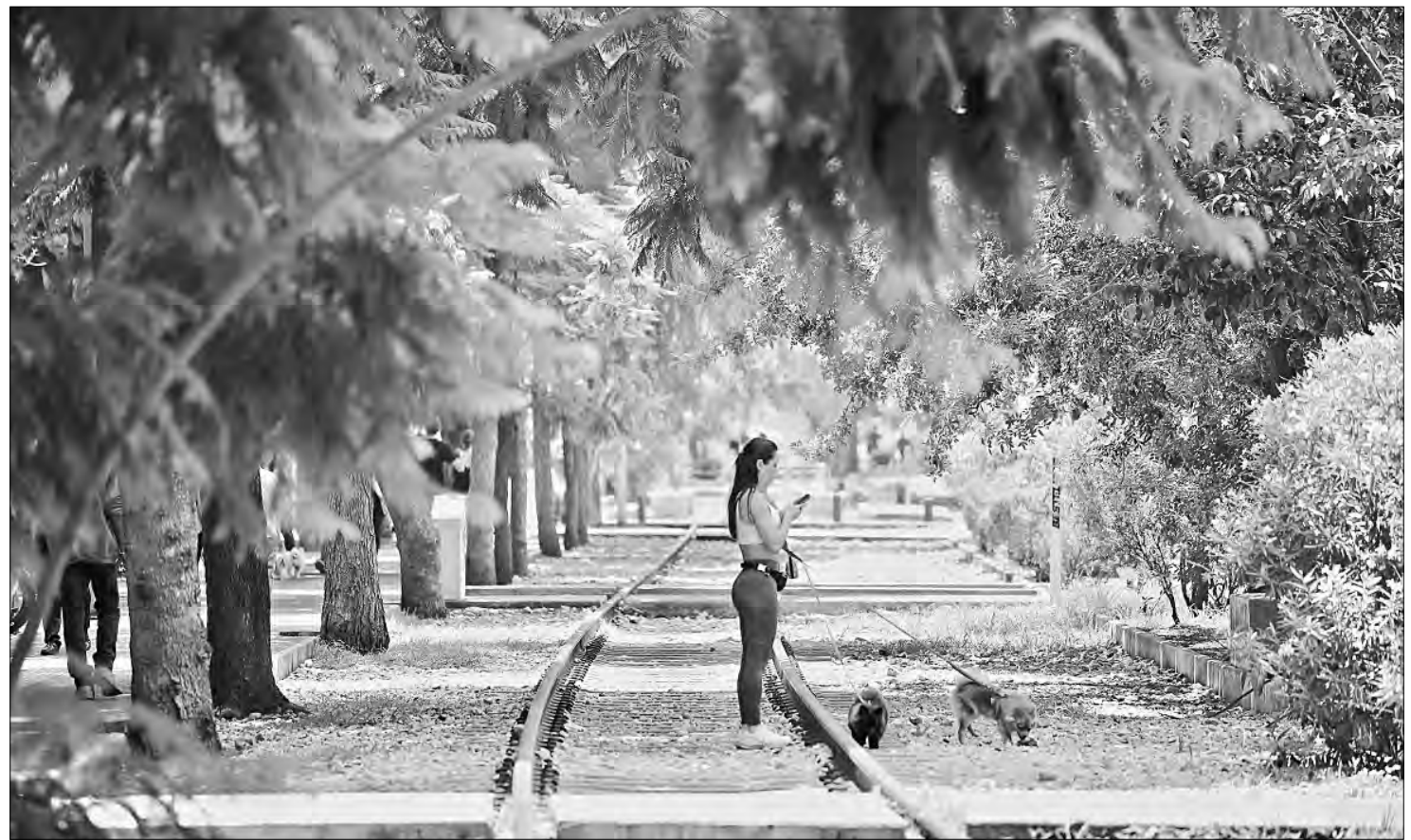
▲ Como escribiera Pita Amor: "separados pero unidos, corren hasta el mar quebrado".