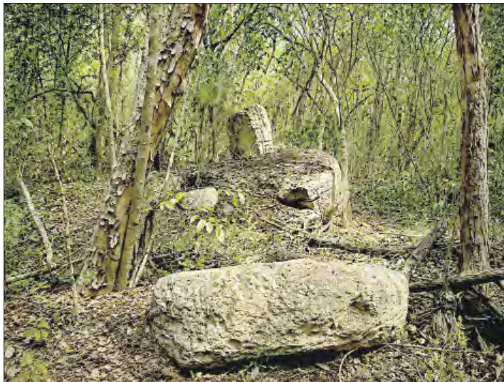
▲ Oculta bajo la selva de Campeche, arqueólogos mexicanos y eslovenos localizaron un sitio monumental que tuvo su apogeo en el periodo Clásico Tardío-Terminal, al que denominaron Minanbé, que en maya significa “no hay camino”.

En Minanbé también se hallaron altares redondos y uno rectangular. Según se desprende de su disposición, varios fueron intencionalmente alterados.