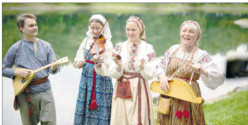
▲ Participantes interpretan música folclórica durante un festival en la finca Ostánkino que celebra el arte y la cultura del siglo XIX en Moscú, Rusia.