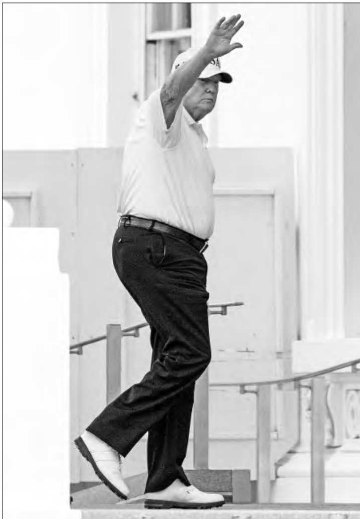
▲ El mandatario de Estados Unidos, Donald Trump, en el pórtico norte de la Casa Blanca.

De Rusia y China a Arabia Saudita (donde a fines de 2017 y principios de 2018 se retuvo por tres meses a miembros de élites adineradas en el Ritz Carlton de Riad hasta que cedieron una participación suficiente en sus empresas), los empresarios han aprendido a no desafiar al gobierno. Pueden dar fe de ello el fundador de Alibaba (Jack Ma) y ex oli-