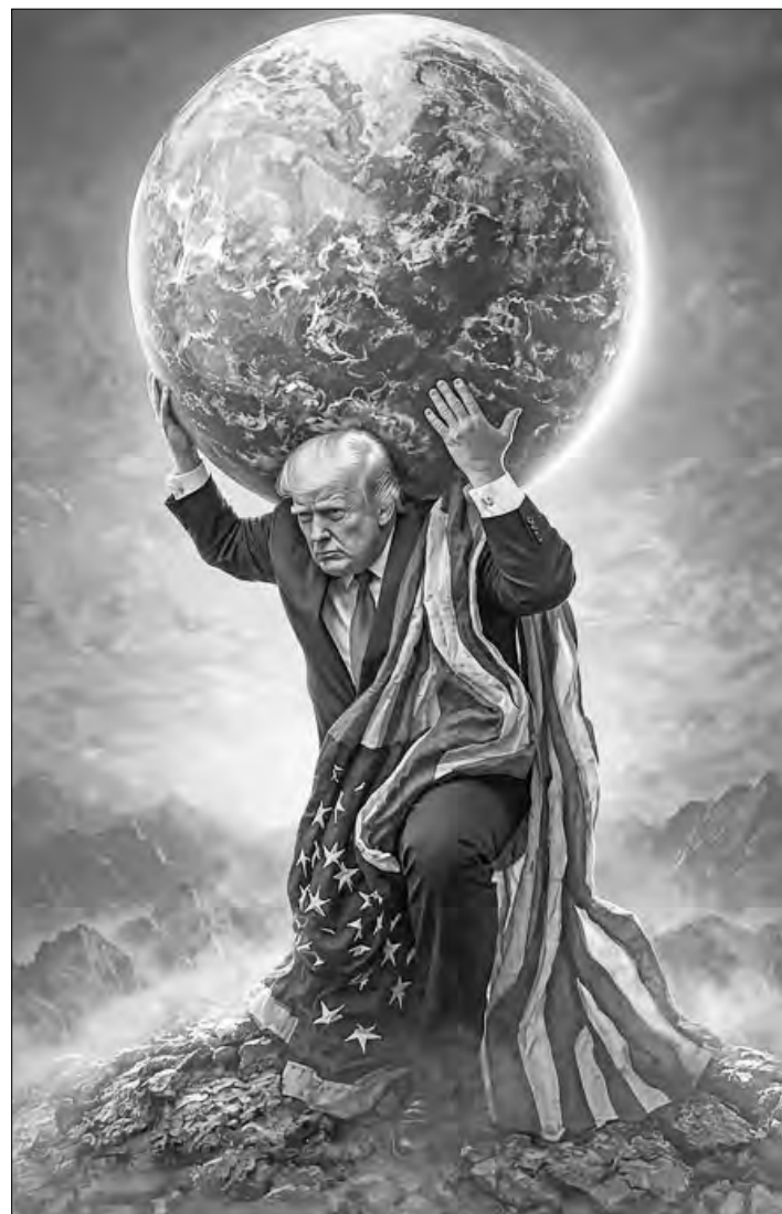
El presidente estadounidense, Donald Trump, publicó ayer otra imagen generada con inteligencia artificial, en la que se presenta como un personaje épico. La postal recuerda al titán Atlas de la mitología griega, condenado a cargar con el peso del mundo por la eternidad.