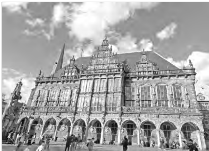
▲ Fachada del Ayuntamiento, edificio que milagrosamente quedó con pocos daños tras la guerra.