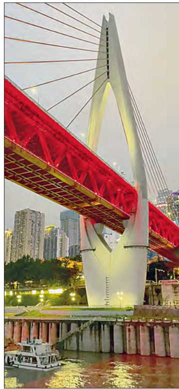
▲ Dos muestras de la impresionante arquitectura vertical de Chongqing.

pasar de una calle envuelta entre rascacielos a otras donde abundan interminables escaleras adoquinadas a las que se debe hacer frente para descubrir algún restaurante bajo un vetusto túnel; caminar por laberintos empedrados y entre las viejas construcciones del antiguo barrio de Xiahao, otro de los puntos que por las noches se viste con luces marrones y atrae a los curiosos visitantes; o testificar cómo el convoy entero del Metro traspasa un edificio habitacional.