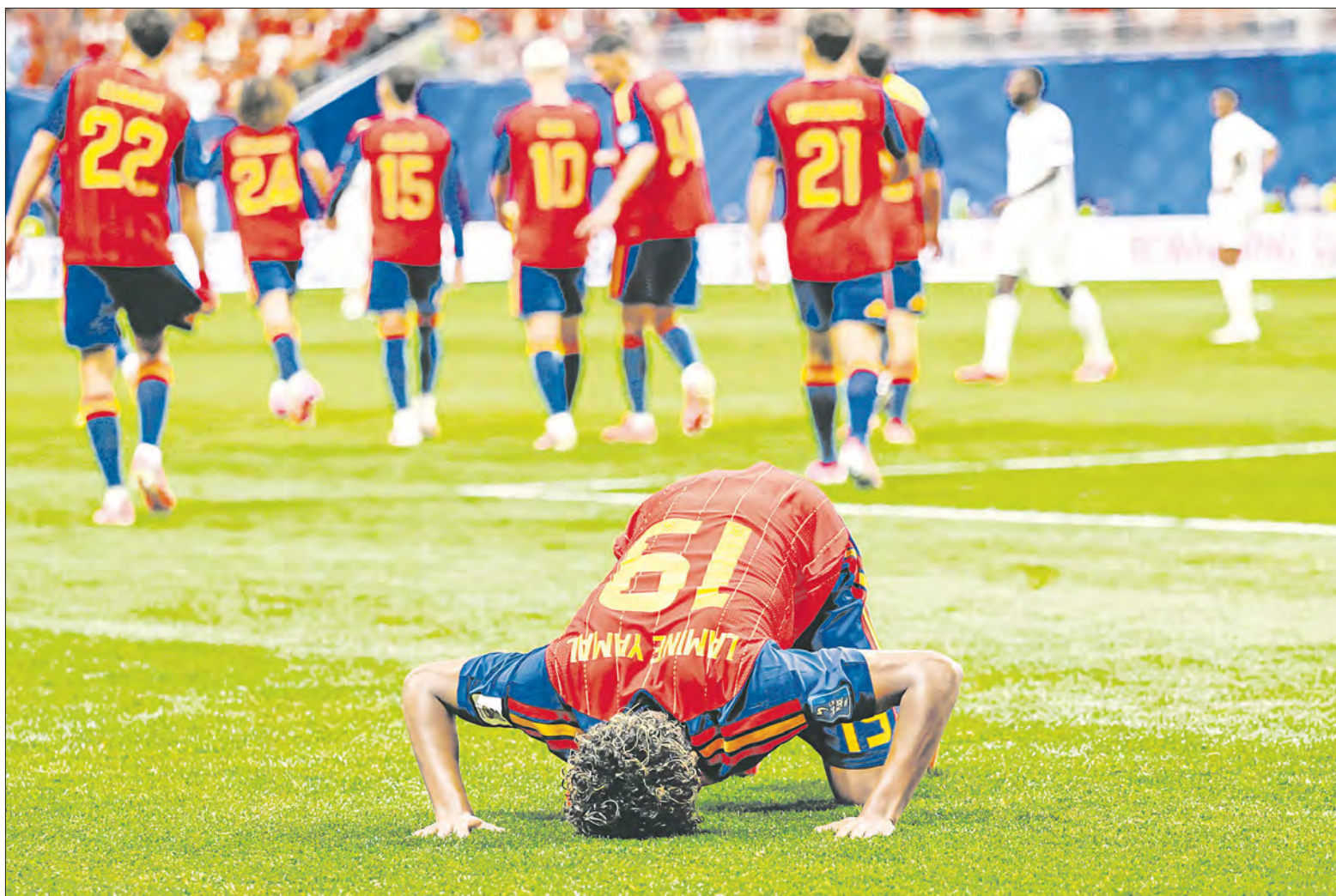
LAMINE YAMAL, DE 18 años, abrió el marcador en la victoria 4-0 de España sobre Arabia Saudita. El ariete de origen marroquí y musulmán festejó de manera particular al arrodillarse y poner la frente en el césped, un acto islámico conocido como sujud en señal de agradecimiento a Alá. De esta manera, respaldó de nueva cuenta a su religión después de que hace unos meses condenó los cánticos islamofóbicos que se han registrado en partidos de La Roja y en La Liga de España.