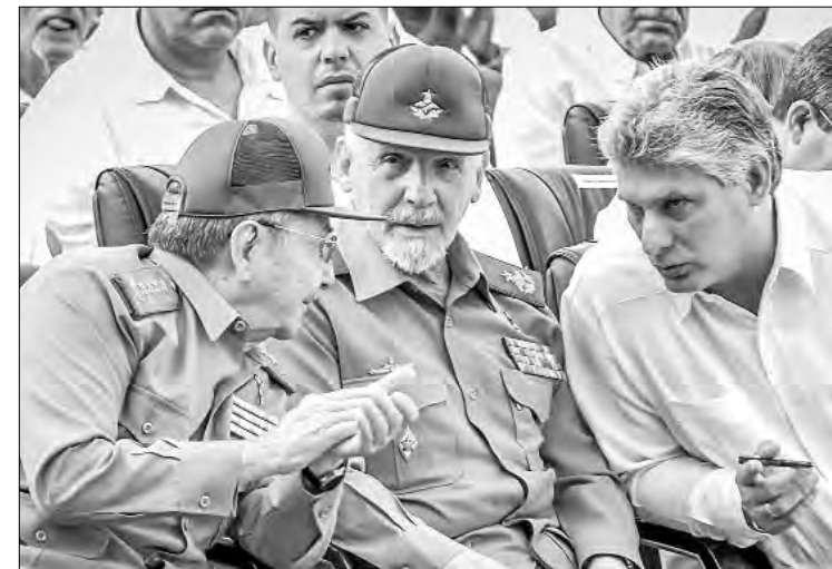
AFP, REUTERS Y AP LA HABANA