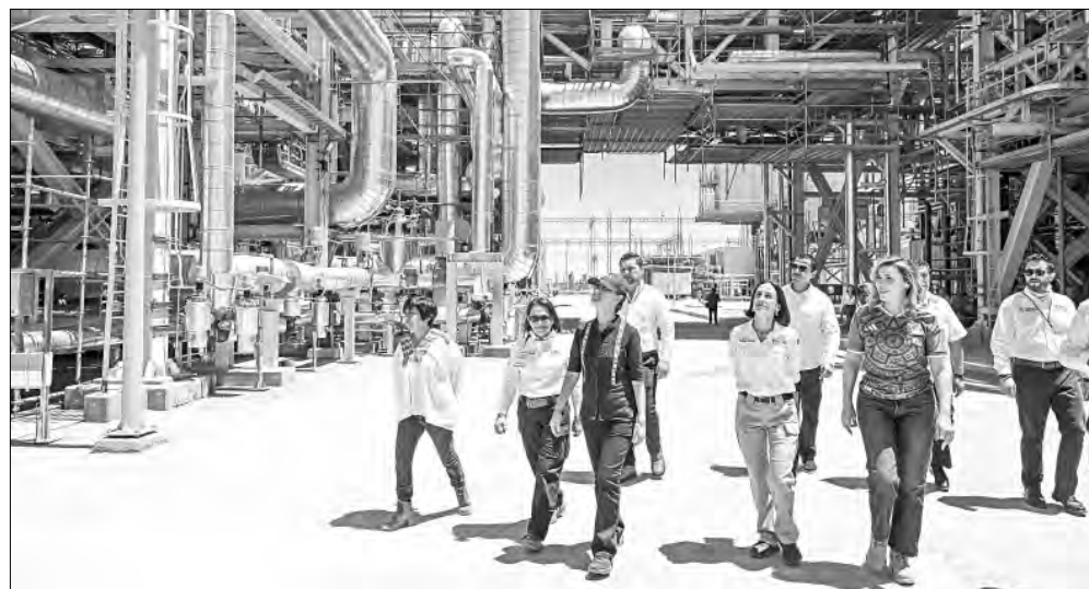
▲ La presidenta Claudia Sheinbaum inauguró la nueva central de ciclo combinado González Ortega, en el Valle de Mexicali, que

AH, ESO SÍ , en su comunicado, Semarnat se compromete a “prevenir, mitigar y atender cualquier posible impacto ambiental derivado del proyecto” y a tener “respuesta rápida ante cualquier contingencia ambiental”. ¡Hasta mañana!