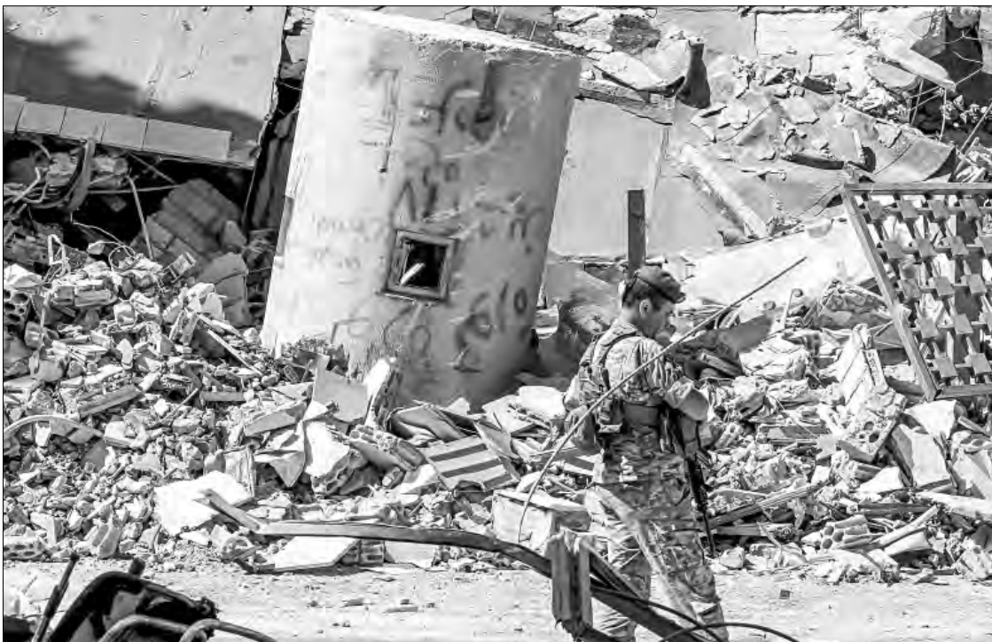
▲ Israel bombardeó ayer el sur de Líbano. En tanto, el líder de Hezbollah, Naim Qasem, rechazó cualquier zona de seguridad israelí en territorio

“Con todo respeto a los estadounidenses, Israel debe dejar claro al mundo entero que la sangre de nuestros hijos y la seguridad de nuestros ciudadanos no es en vano”, señaló.