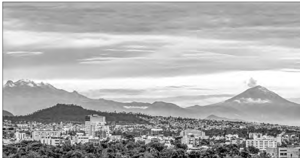
▲ Sin lluvia y con el cielo despejado lució ayer la Ciudad de México, que permitió ver los

¿SE ACUERDAN DE París hace unos días? cd_perdida@jornada.com.mx