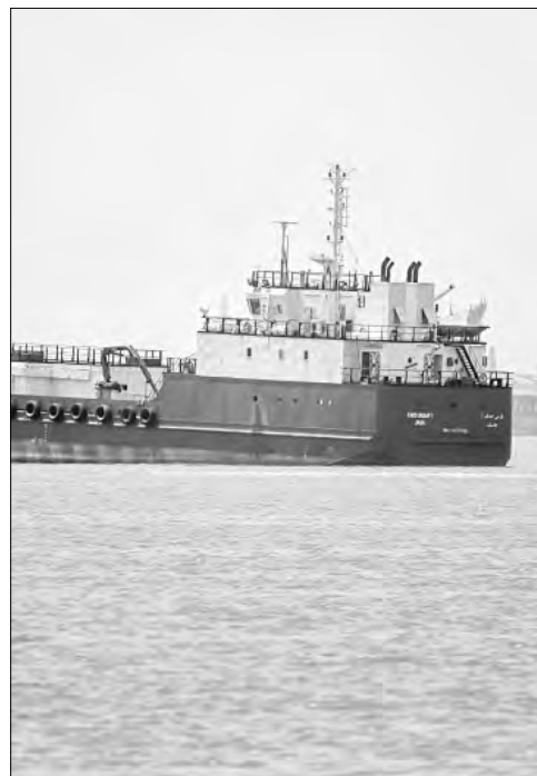
▲ Donald Trump amenazó con cobrar peaje en el estrecho de Ormuz, dominado por Irán.

Twitter: @cafevega cfvmexico_sa@hotmail.com