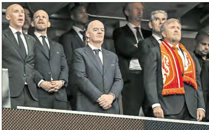
▲ La FIFA y sus dirigentes eligen viajar en vuelo comercial o privado, según lo que sea más eficaz y económico.

No dejan entrar al campo, pero sí que los jugadores reciban las indicaciones cuando salen a tomar agua