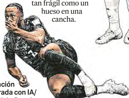
Ilustración elaborada con IA/ Gemini de Google

SI ESCUCHAMOS LAS melodías de Wittgenstein no podemos dejar de imaginar su brazo fantasma, del mismo modo que nos afecta recordar a un futbolista tras un accidente de auto. Cuando un artista o un atleta pierde la parte más simbólica de su cuerpo, escuchamos un crujido que espanta. Un sonido de madera que se troza recuerda que el sentido es tan frágil como un hueso en una cancha.