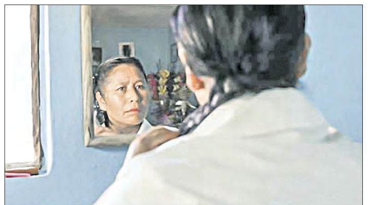
▲ Fotogramas de la película Mamá registrada por Juan Antonio Méndez Rodríguez

Los documentales seleccionados podrán verse a través de las distintas plataformas de Plural Tv, el próximo 9 de agosto, en el marco del Día Internacional de los Pueblos Indígenas.