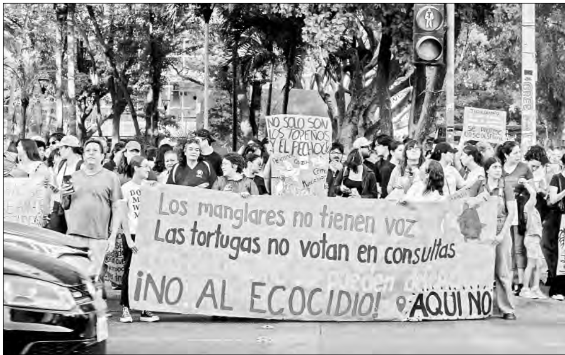
◀ Estudiantes y ciudadanos se sumaron a las protestas del colectivo ¡Aquí No! el pasado 17 de junio en la Bahía de Ohuira.

planteando el desarrollo de una actividad que aún necesitamos evaluar si está teniendo un impacto o no; para poder tomar cualquier determinación de naturaleza administrativa dentro de alguna pesca, necesito la opinión de Imipas”, indicó la dependencia.