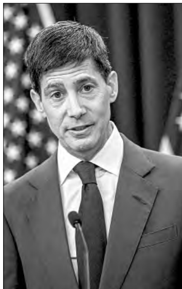
▲ Kevin Warsh dictó ayer su primera sesión del sistema de la Reserva Federal.