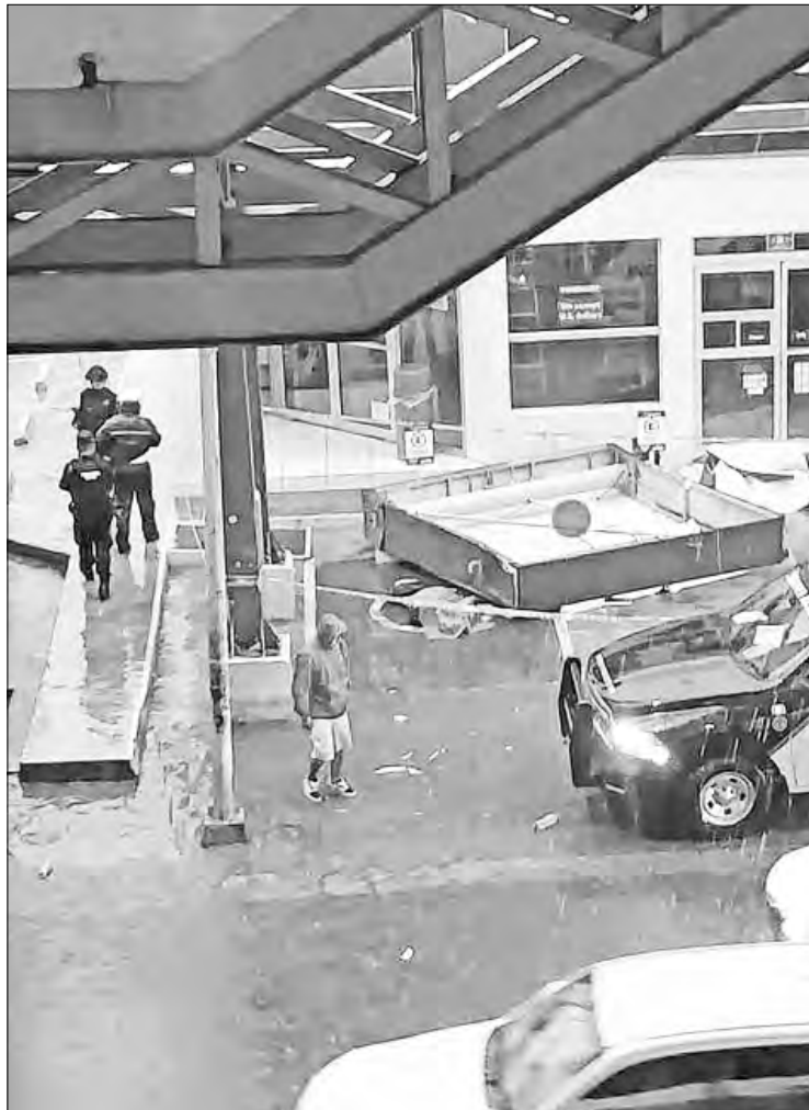
▲ Una mujer falleció por la caída de un anuncio espectacular en la avenida Universidad.

Personal de rescate realizó un operativo tras el reporte de un menor arrastrado por la corriente de un canal en la zona de Valle Verde también en la capital nuevo-