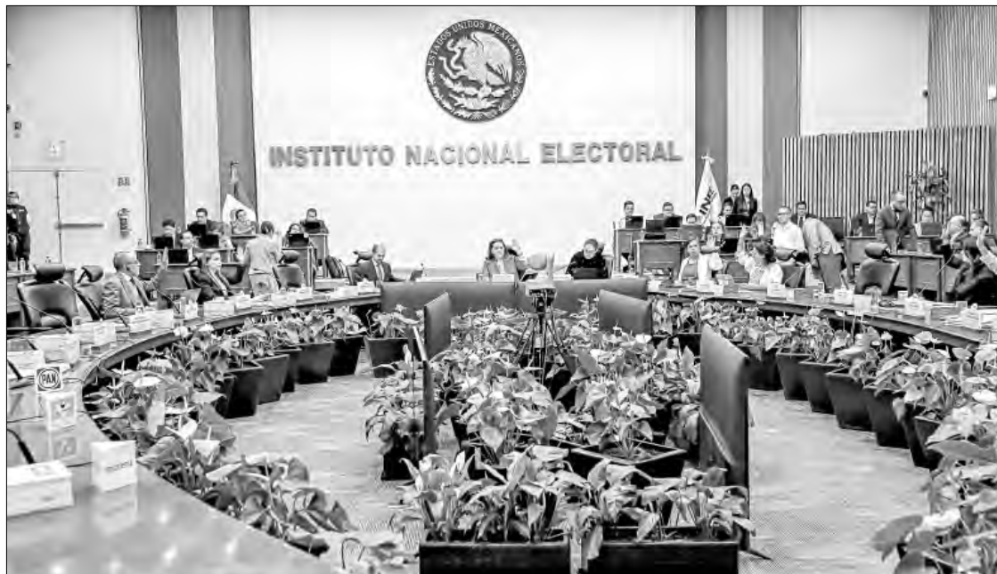
▲ El Instituto Nacional Electoral determinó las sanciones por inconsistencias contables y