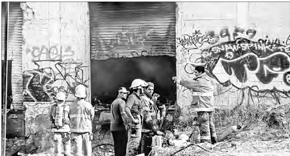
▲ En 2009, el incendio de la guardería ABC, en Hermosillo, Sonora, cobró la vida de 49

Twitter: @cafevega cfvmexico_sa@hotmail.com