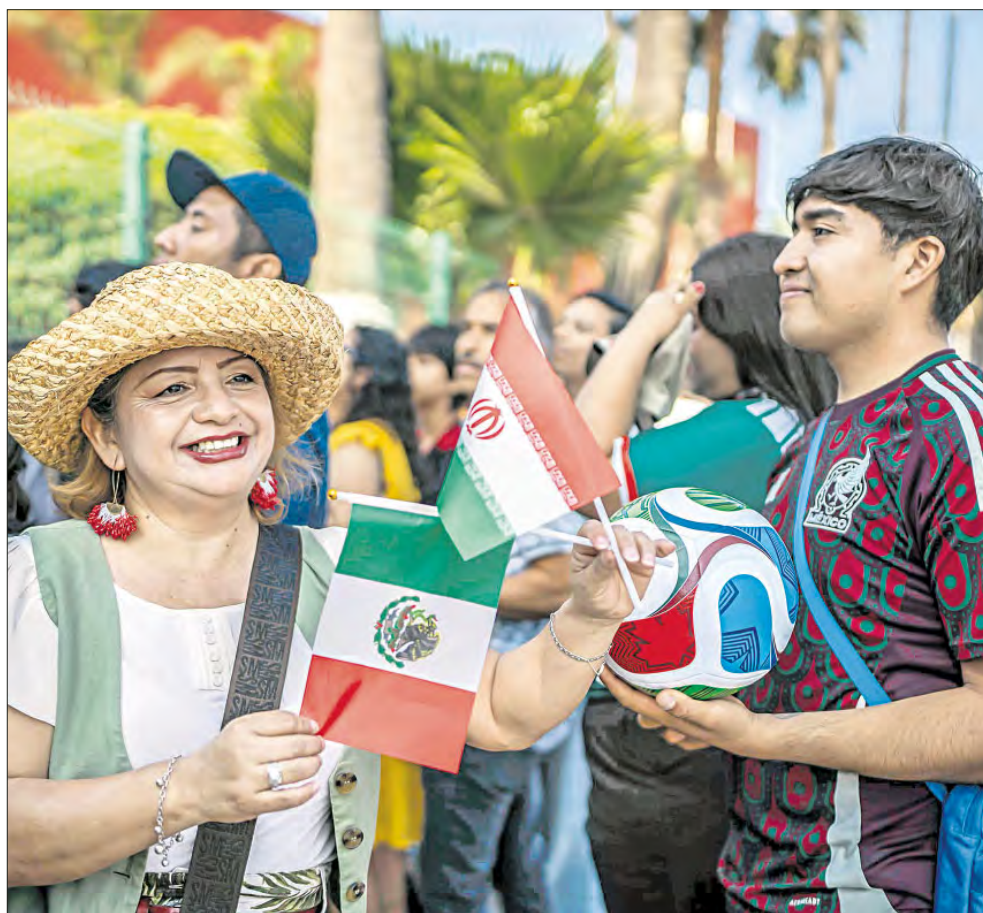
▲ En México las calles están llenas de aficionados de todas las nacionalidades, hay celebraciones espontáneas, hospitalidad y un

Y esa es una victoria que no aparece en el marcador, pero que permanece en la memoria mucho después del pitazo final.