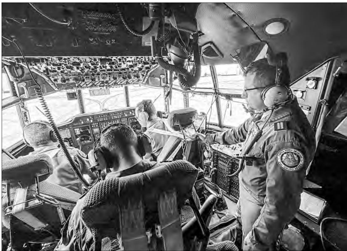
▲ El capitán Tonatiuh Gutiérrez explica la alta capacitación que recibe el personal del escuadrón de la Fuerza Aérea Mexicana.

Antes de ocupar la titularidad del Ejército Mexicano, el general Ávila Alcocer estuvo al frente de la Tercera Región Militar, con sede en Mazatlán, zona que por su ubicación le corresponde actuar en contra de las facciones de grupos criminales como Los Chapitos y La Mayiza , que se disputan el control de la zona turística y también las rutas de recepción y trasiego de drogas.