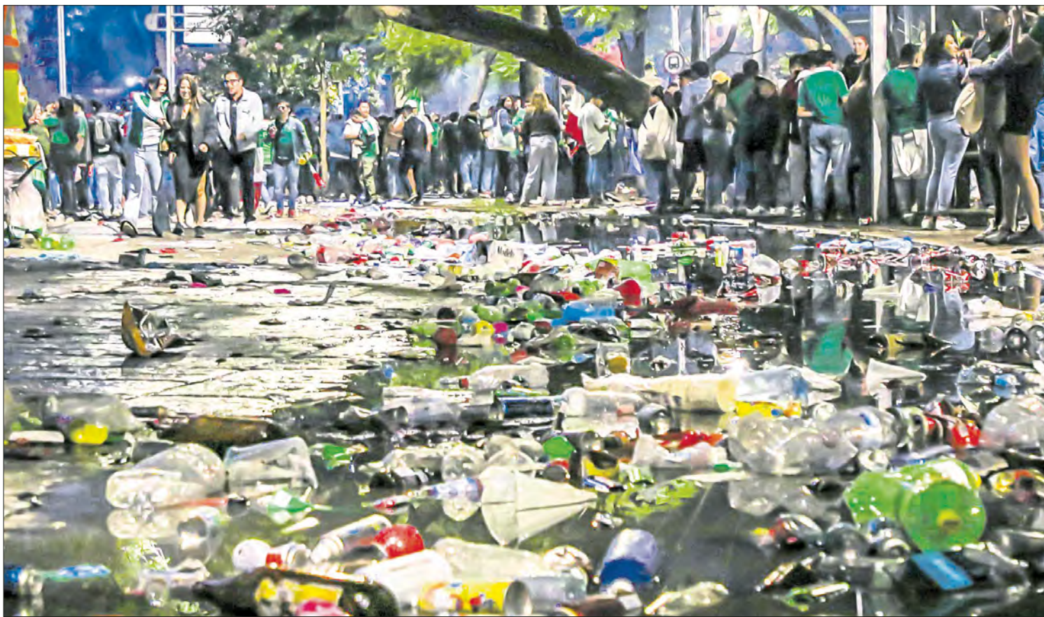
▲ La celebración por el triunfo del equipo mexicano en el Ángel de la Independencia dejó gran cantidad de desechos, flores de cempasúchil destrozadas y algunas estaciones del Metrobús con