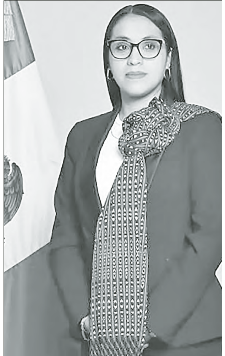
▲ La alcaldesa morenista de Tenancingo, estado de México, Nancy Nápoles Pacheco, en imagen tomada de redes sociales.

Afirmó que estos sujetos llevaron a Nancy Nápoles a la comunidad San Pedro Zictepec, en el municipio contiguo de Tenango, donde la dejaron ir, pues ya había una intensa movilización policiaca que la buscaba, y la edil decidió desistir, pues