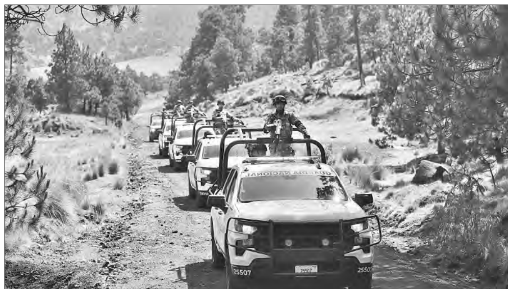
▲ Operativo para combatir la tala ilegal en el Bosque de Agua, en el Ajusco, alcaldía de