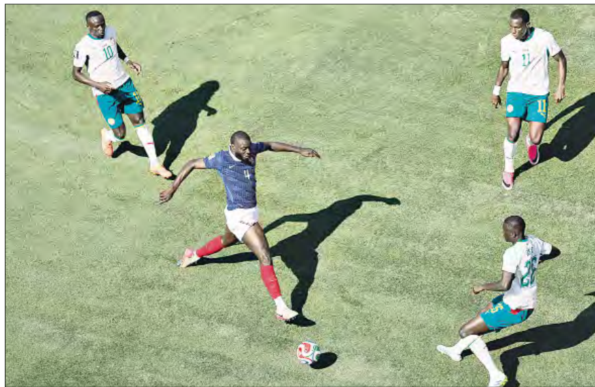
▲ El jugador Dayot Upamecano (4) durante el partido de fútbol del Grupo I de la Copa Mundial entre Francia y Senegal.

Así como la afición hispana ha tratado como mono a Vinicius Jr o como moro a Yamin Yamal, don Infantino les hace fuchi a los salvajes, Trump ordena restricciones para los sudafricanos que no son afrikaner y para cualquier oscuro que incomode al WASP promedio. Sin embargo, el mejor fútbol hoy es de raíz africana.