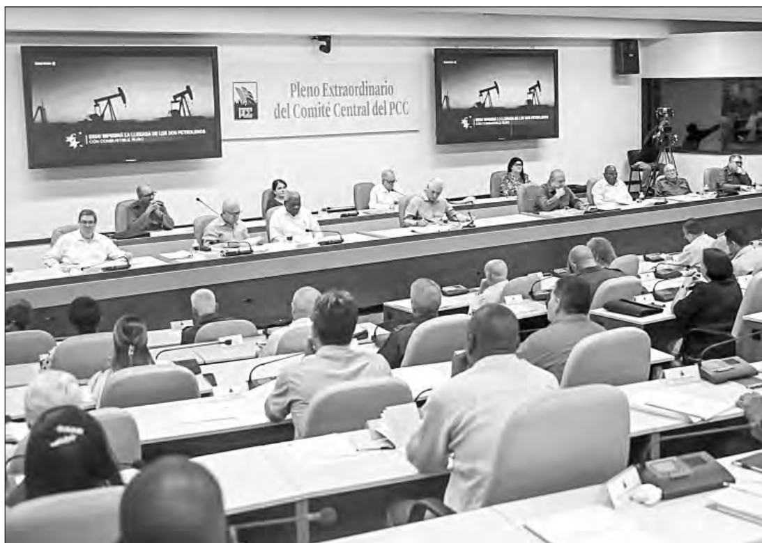
▲ El presidente Miguel Díaz-Canel asistió a la reunión del Partido Comunista donde altos dirigentes plantearon el paquete de reformas.

El comité central del PCC analizó en el pleno extraordinario una veintena de propuestas orientadas a abrir más sectores a la inversión privada, atraer mayor capital de cubanos residentes en el exterior y reducir el tamaño del aparato del Estado, en medio del bloqueo petrolero impuesto por Estados Unidos a la isla desde enero.