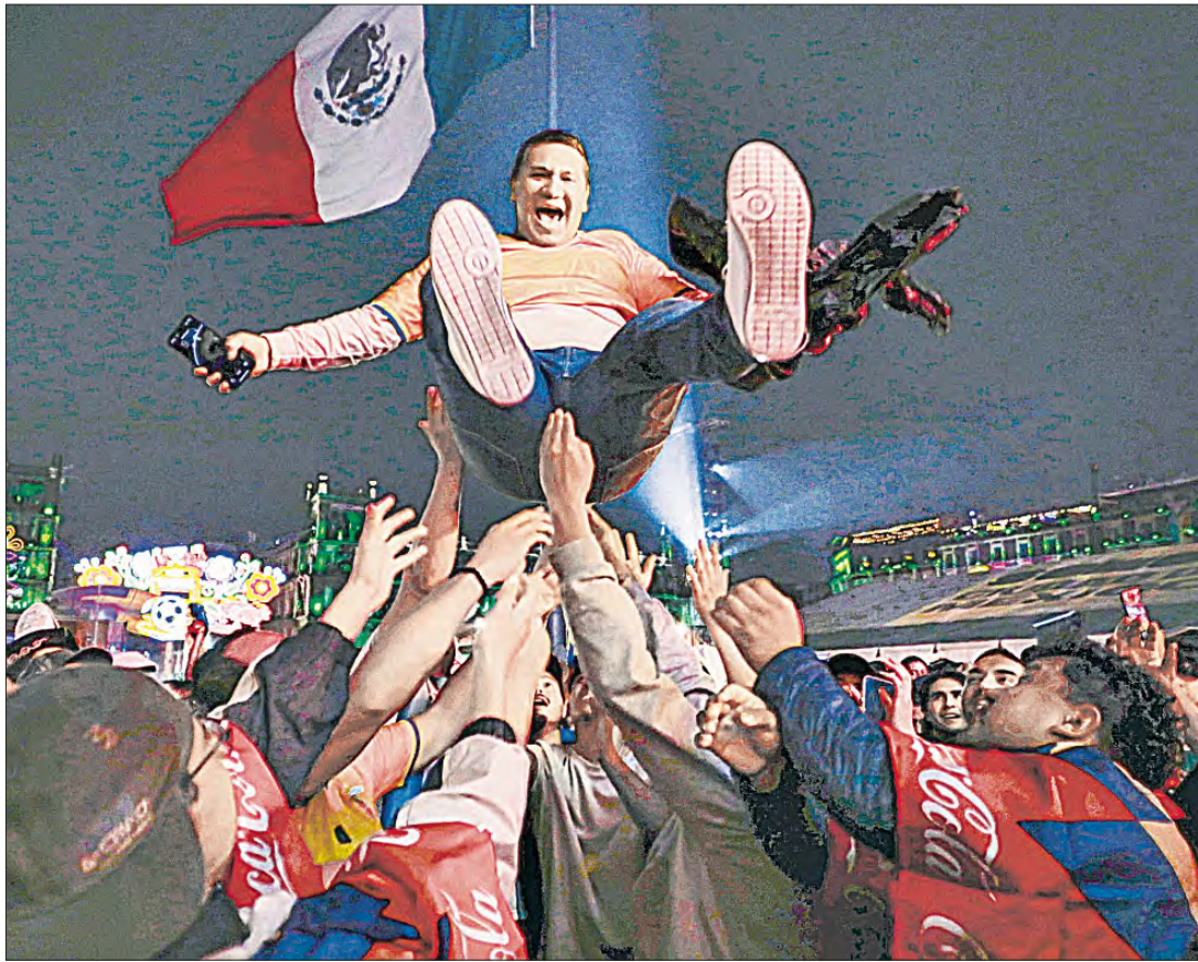
▲ Colombia debutó ayer con una contundente victoria de 3 a 1 sobre el conjunto asiático en un plebiscito en el estadio Azteca, pero la marea amarilla