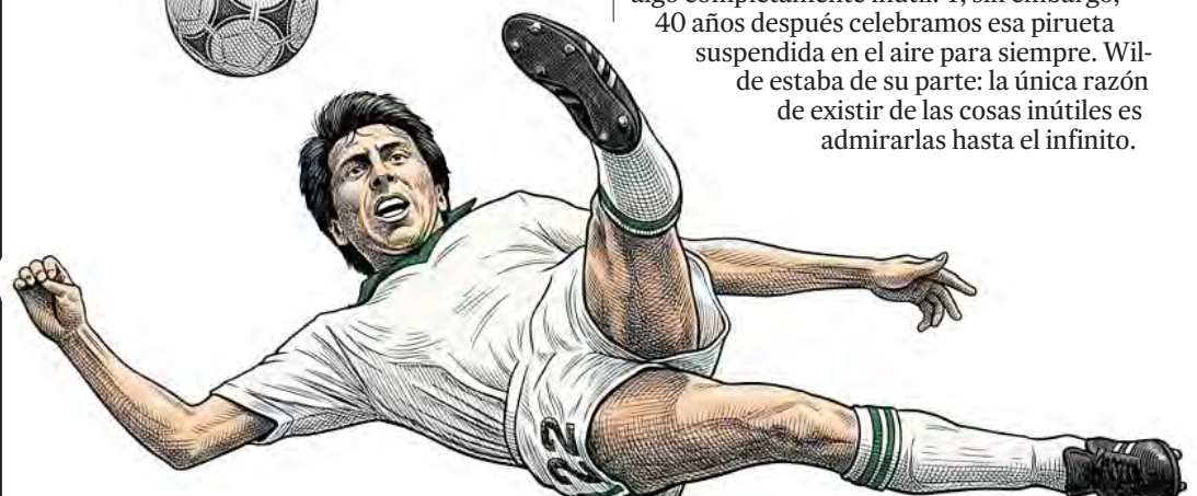
ilustración elaborada con IA/ Gemini de Google

Pelé . Es decir, que la pirueta efímera era más hermosa por su espontaneidad que las evoluciones virtuosas que ejecutaron dos de los mayores genios en la historia del fútbol.