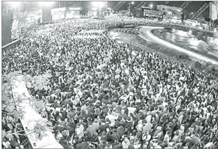
▲ Miles de personas asistieron ayer en la noche al concierto que ofreció la banda tapatía de rock Maná en la Glorieta de la Minerva, en Guadalajara, Jalisco.

JUAN CARLOS G. PARTIDA CORRESPONSAL GUADALAJARA, JAL.