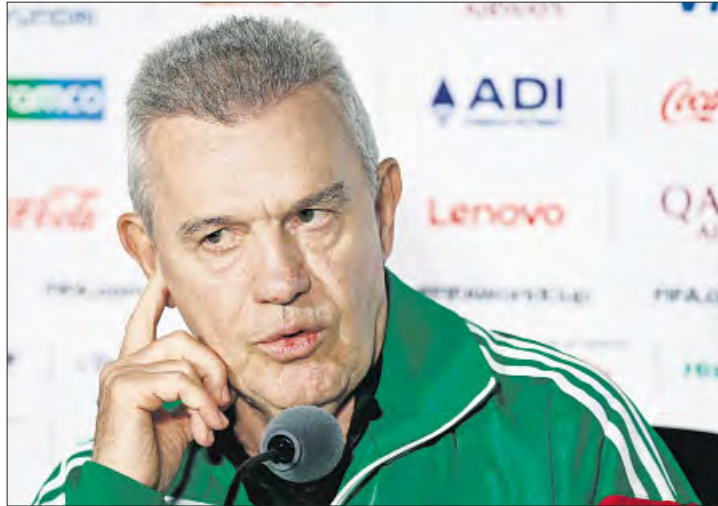
▲ El seleccionador mexicano Javier Aguirre, durante la conferencia de prensa.

“Tengo 67 años, 50 en el bendito fútbol, y todavía siento algo antes de cada partido. Es un nerviosismo difícil de explicar, pero el día que no tenga eso mejor me voy a mi casa”, agrega Aguirre. “¿Qué hice después