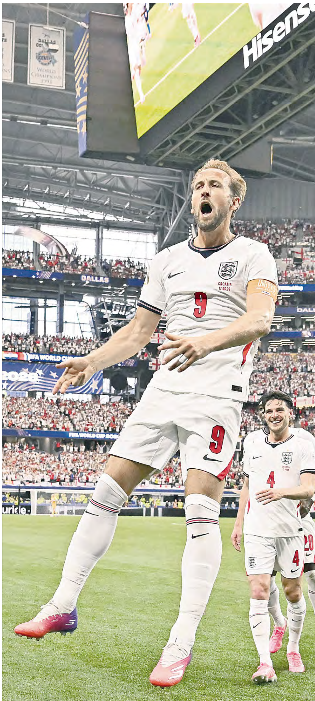
▲ Un Harry Kane en plenitud marcó un doblete, el cual le permitió alcanzar la marca de Gary

Bellingham (47) pondría el tercer tanto con una gran jugada en solitario al recibir un pase largo y romper a la defensa rival a gran velocidad y sentenciar a quemarropa. Ya frente a una Croacia que bajó el ritmo tras la salida de Modric, Rashford se encargaría de coronar el triunfo al 85 para desatar la euforia de los ingleses que anhelan un segundo título mundialista.