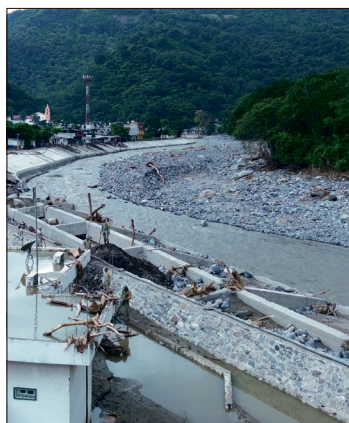
▲ Atenderán 48 estructuras estatales, de las cuales 20 serán nuevas y 28 en reconstrucción.

Hasta el momento, el avance en la reconstrucción de puentes es de 33%, se atiende a 16 municipios y están por iniciar trabajos en cuatro más