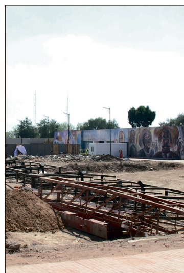
▲ El costo de la construcción de la nueva sala de plenos del Congreso pasó de un cálculo de 80 millones a 100 millones de pesos.

Nota: Los casos no previstos en la presente Convocatoria serán resueltos por la CPCE-F, cuyo fallo será definitivo e inapelable.