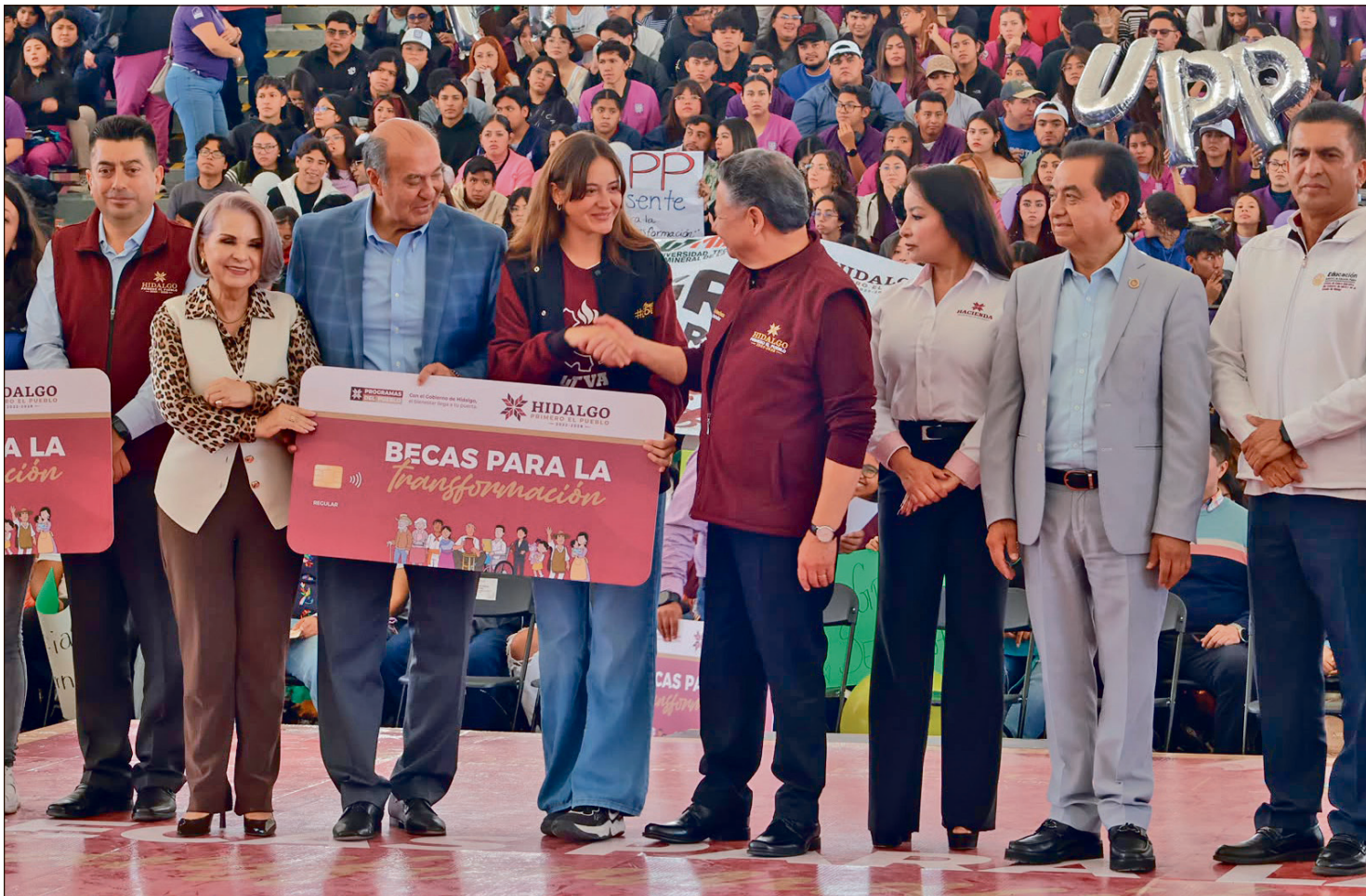
▲ En esta primera etapa fueron otorgados 6 mil 800 apoyos, en un evento protocolario realizado en las instalaciones de la feria de Pachuca.

MARTES 16 DE JUNIO DE 2026 HIDALGO // AÑO 6 NÚMERO 1822 // Precio 10 pesos