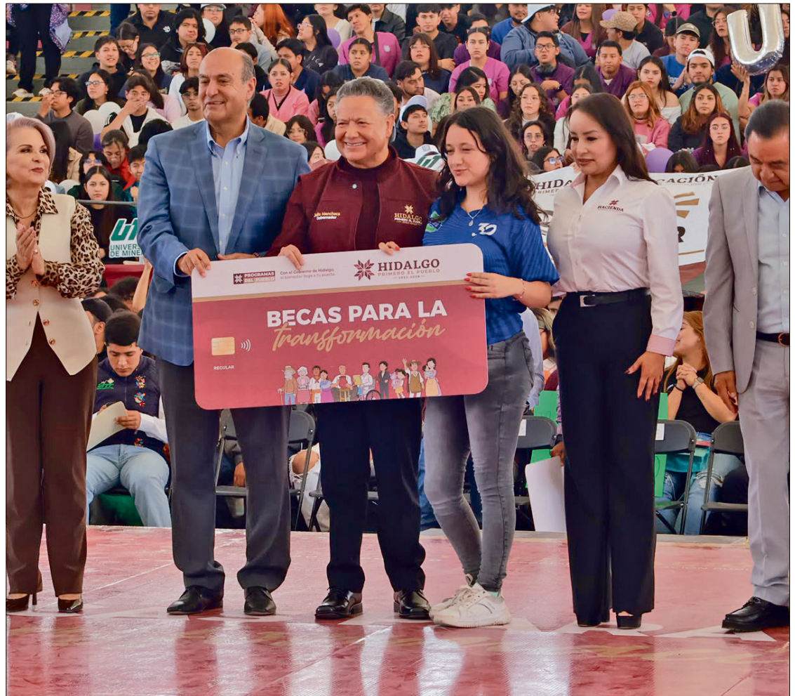
▲ Debido a que el apoyo económico se entrega en dos etapas, en esta primera fueron otorgadas 6 mil 800 becas en evento protocolario realizado en las instalaciones de la feria, en Pachuca.

El mandatario coincidió en que Hidalgo es el segundo estado que más apoya con becas la educación superior a nivel nacional y detalló que en el inicio de esta administración se destinaban a la juventud hidalguense cerca de 24 mil 700 millones de pesos en 2022, mientras que actualmente