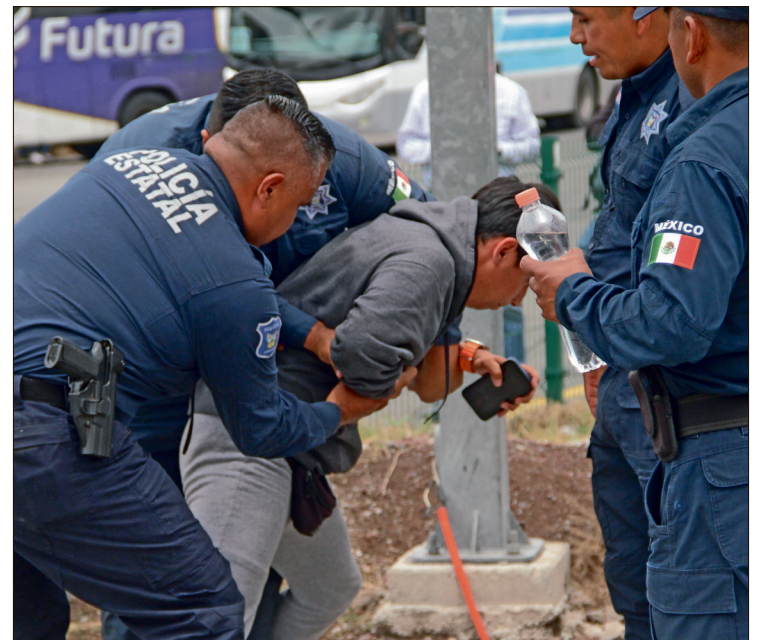
▲ Respecto al robo a transeúntes en espacio abierto al público, como parques, las cifras tuvieron un incremento considerable.

De acuerdo con el marco legal, en el robo con violencia se utiliza fuerza física o intimidación moral (amenazas) sobre la víctima, un tercero, o quienes acuden en auxilio.