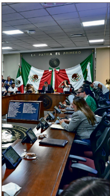
▲ Según señalaron los diputados, la presidenta Claudia Sheinbaum ha advertido sobre maniobras de la ultraderecha internacional y sectores conservadores.

Este mismo decreto, en su transitorio, obliga a las legislaturas locales a armonizar el marco normativo y adicionar como causal de nulidad de las elecciones la acreditación de actos de intervención o injerencia extranjera que influyan en los resultados electorales.