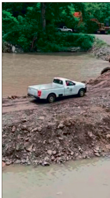
▲ El constante incremento del caudal del río terminó por destruir repetidamente cada uno de los pasos temporales.

se atiende una demanda histórica y urgente de las localidades afectadas, cuyos habitantes esperan que los días de ejecución transcurran sin contratiempos climáticos para consolidar, finalmente, una conexión permanente y segura con la cabecera municipal y el resto de la región.