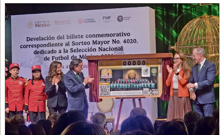
▲La impresión del billete se retrasó hasta contar con la fotografía oficial del equipo.

Indicó que el gobierno federal impulsa un legado deportivo, “razón por la que nuestra presidenta nos instruyó rehabilitar y construir más de 4 mil 200 canchas y la realización de una copa escolar con 1.2 millones de participantes”.