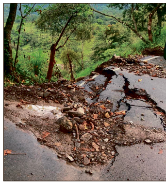
▲ El complejo pronóstico meteorológico ha obstaculizado la rehabilitación de caminos, puentes y accesos provisionales.

Hasta el momento, se reportan tres comunidades incomunicadas, principalmente en las regiones Otomí-Tepehua y la Huasteca. Ante esto, el Ejecutivo estatal mantiene coordinación con la Secretaría de Infraestructura, Comunicaciones y Transportes (SICT) para acelerar las maniobras en cuanto