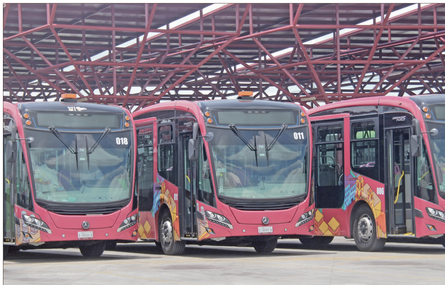
▲ Con las nuevas unidades se redujo en 20 minutos el traslado de usuarios del Centro hasta Téllez, aunado a la recuperación del carril confinado. Foto Benjamín H. V. / P3

“¿Tenemos el derecho humano a morir con dignidad? ¿Cómo se garantiza? ¿Cuáles son las obligaciones del Estado? Para quienes militamos en esta causa sabemos que sí es un derecho y necesitamos que se deje de criminalizar”. Ninde MolRe / P4