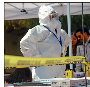
▲ Entre los ilícitos con mayor aumento destaca el homicidio, que pasó de 33 carpetas de investigación en abril a 49 en mayo, es decir, 16 casos más en un mes.

Por otra parte, los delitos contra la libertad personal también mostraron un aumento al pasar de 172 casos en abril a 182 en mayo.