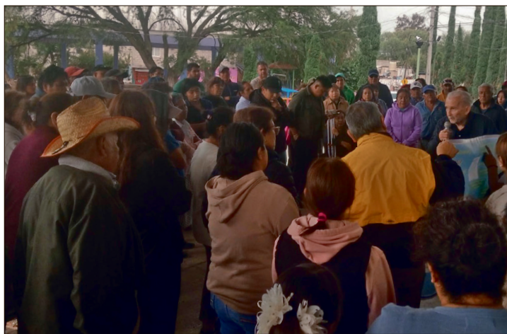
▲ El terreno pertenece a un colono de Tezoquipa, a quien se le propuso que, en lugar de destinarlo a las Casas del Bienestar, lo divida en lotes y los ponga a la venta exclusivamente para habitantes de la comunidad.

Mediante una asamblea comunitaria, vecinos de Tezoquipa votaron para que el proyecto no se instale en esta zona