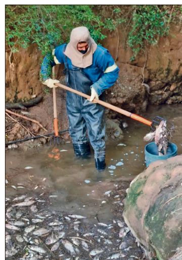
▲ La laguna de Bojay es un cuerpo de agua alimentado por manantiales y se encuentra semiaislado del río Tula, a unos tres kilómetros del centro de Tula y a unos cuatro kilómetros del espejo principal de la presa Endhó.

El fallo será inapelable en cada etapa y categoría.