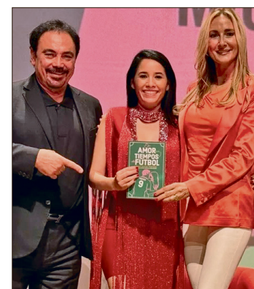
▲ El amor en tiempos de fútbol es una obra que durante seis años tomó forma para narrar las vidas de nueve mujeres que compartieron el camino con algunas de las mayores figuras del fútbol mexicano.

Las historias hablan de cambios de país, hijos que deben adaptarse a nuevas escuelas, mudanzas constantes, lesiones, convocatorias perdidas y la incertidumbre permanente de una carrera deportiva.