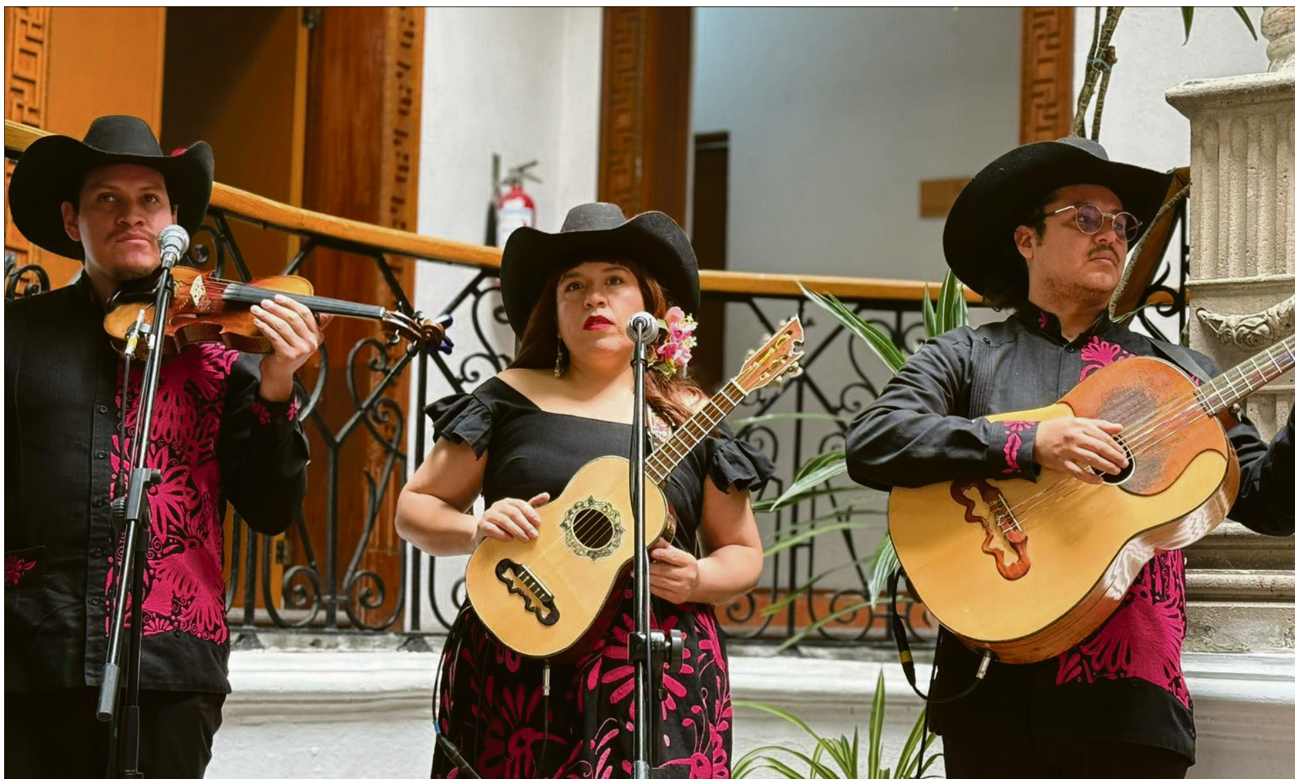
▲ Aunque siempre estuvieron rodeados de música, comenzaron tocando únicamente por afición.

LA AGRUPACIÓN CUMPLE NUEVE AÑOS DE TRAYECTORIA