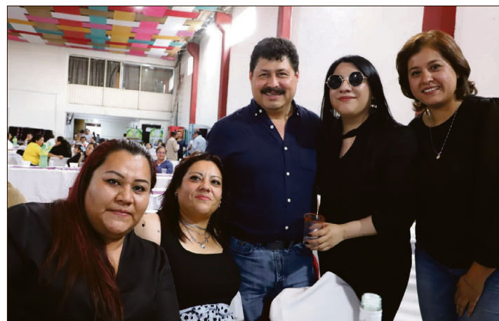
▲ El anuncio se realizó durante un encuentro con docentes de la región.

El gobierno municipal reiteró su compromiso de continuar impulsando gestiones que permitan mejorar los servicios de salud y el bienestar de las familias locales, con especial énfasis en quienes integran el sector educativo