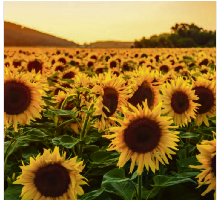
▲ El evento ofrece un espacio de convivencia familiar rodeado de la estética natural que brindan los girasoles.

Tras el éxito obtenido en su primera edición el pasado mes de octubre, el evento no solo busca la reactivación económica de los pequeños productores, sino también ofrecer un espacio de convivencia familiar rodeado de la estética natural que brindan los girasoles.