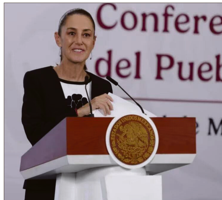
▲ La presidenta matizó el anuncio oficial y sostuvo que todavía no hay una definición final sobre el calendario.

Delgado explicó que cualquier ajuste adicional se acordará con maestras, maestros y representaciones sindicales.