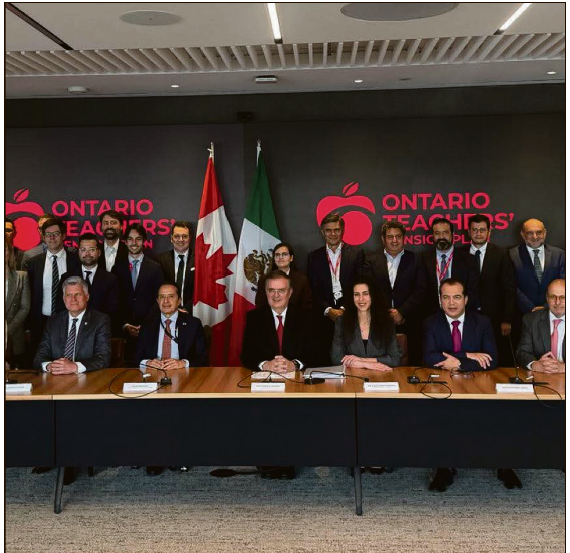
▲ La empresa Solar International Core Canada y el gobierno de Hidalgo formalizaron la construcción de una planta de ingredientes farmacéuticos activos en territorio hidalguense.

“Cerramos el día con una inversión de 2 mil millones de dólares para Hidalgo. Solo con eso ya valió la pena toda la misión, aunque estamos teniendo muchos más resultados”, afirmó el secretario federal.