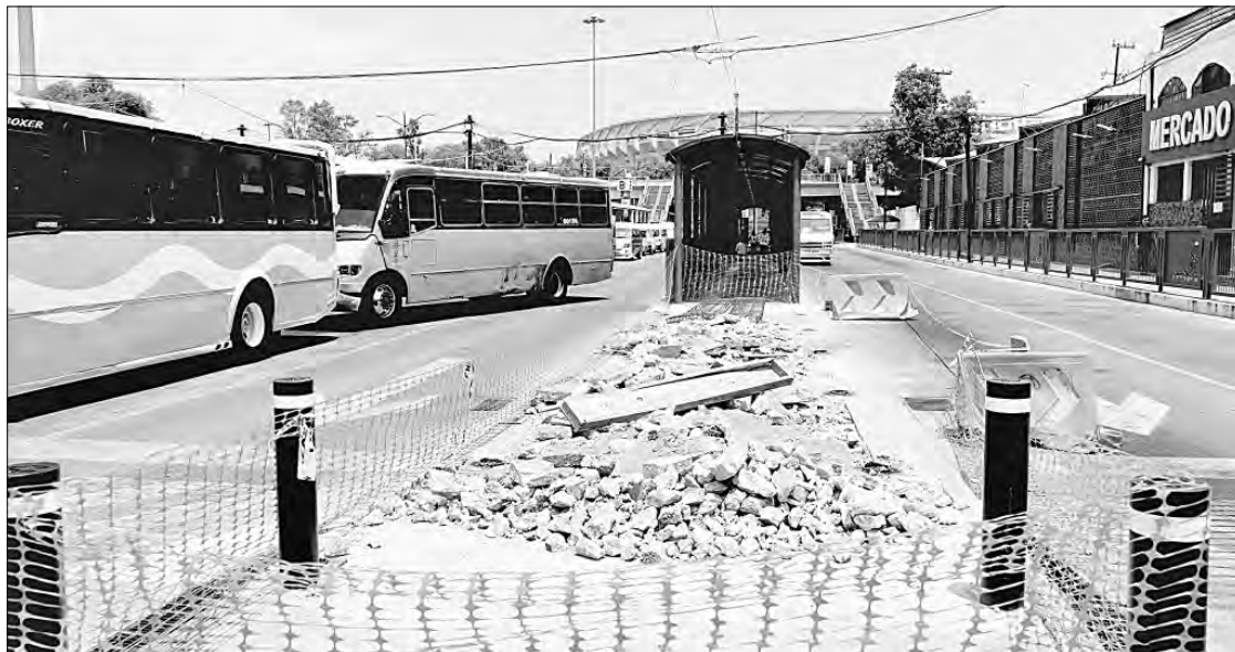
◀ A escasas semanas del comienzo del Mundial continúan sin fecha de entrega las obras en el Cetram Huipulco (esta imagen), donde estará la terminal del Trolebús que conectará el estadio Azteca con Ciudad Universitaria.

Asimismo, en las banquetas hay registros sin tapa que son utiliza-