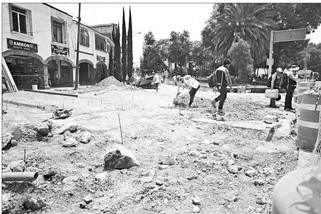
▲ Debido a los trabajos de mejoramiento urbano, que la alcaldía comenzó sin aviso previo, la avenida Guadalupe I. Ramírez, acceso principal al centro de

Recordó que en Xochimilco existen sólo dos accesos, de los cuales la avenida Guadalupe I. Ramírez es el principal, ya que desde ahí se conectan los diferentes pueblos de la demarcación. Apuntó que, ante el avance de las remodelaciones, persisten necesidades como poda de árboles, mantenimiento a áreas verdes y atención a problemas urbanos por falta de luminarias, bacheo y drenaje.