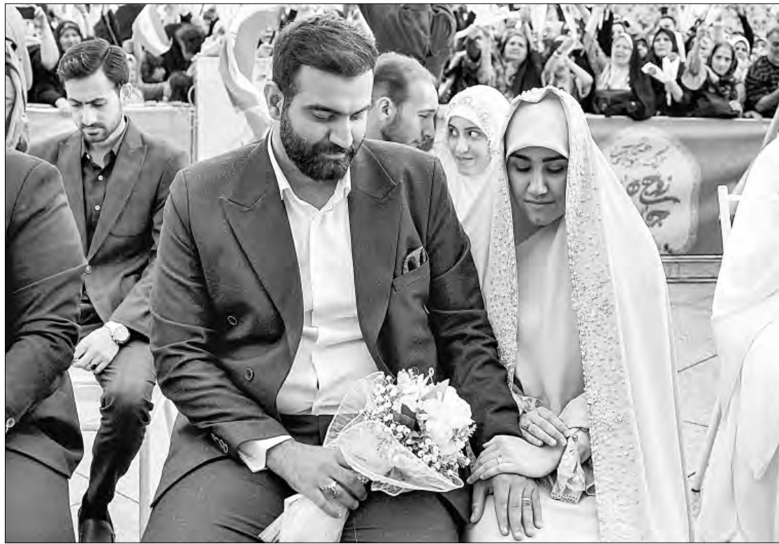
▼ Una ceremonia nupcial pública se llevó a cabo en la plaza Imam Hossein de Teherán, ayer.

Antes afirmó que "no está dispuesto" a hacer concesiones y advirtió, durante una entrevista con el New York Post , que Irán "sabe lo que va a pasar pronto", luego de que