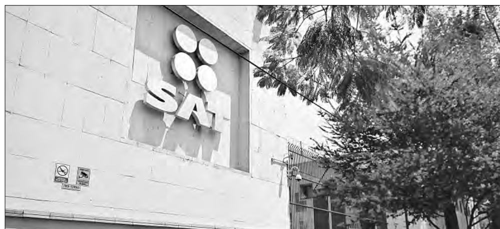
▲ El recaudador de impuestos de la 4T sí le cobra a Salinas Pliego.

Twitter: @cafevega cfvmexico_sa@hotmail.com