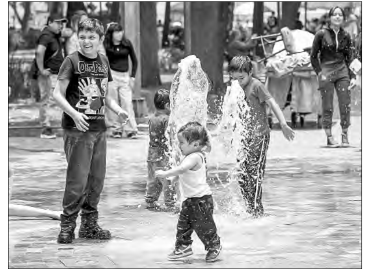
▲ Los chorros danzantes de la Alameda Central de la Ciudad de México son un espacio ideal para sortear las temperaturas cercanas a 30 grados centígrados que se han registrado en los últimos días.