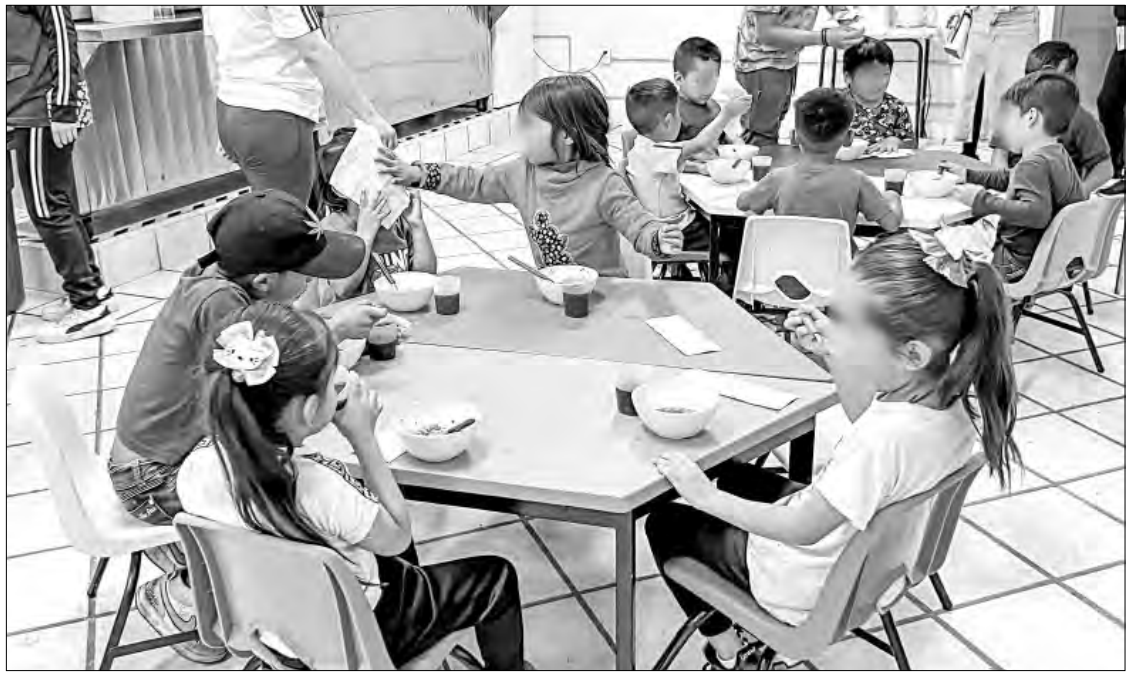
▲ En el Centro de Día de la Central de Abasto la hora de comer parece también la del recreo para

El Centro de Día opera en dos horarios, de 9 a 13 horas y de 14 a 17, con el acompañamiento de más de una decena de profesores que procuran su desarrollo educativo, social y emocional.