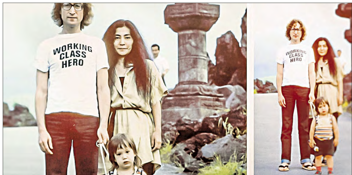
▲▶ John Lennon, Yoko Ono y Sean Lennon en una de las imágenes del álbum familiar del documental John Lennon: The Last Interview. A la derecha, el director Steven Soderbergh.

“Cada persona creativa va a tener su propio prisma y se verá afectada de maneras diferentes. Nuestro deseo inherente de tener una plantilla simple sobre cómo debe abordarse esto es parte del problema. No creo que eso sea posible. No creo que haya una solución única para todos.”