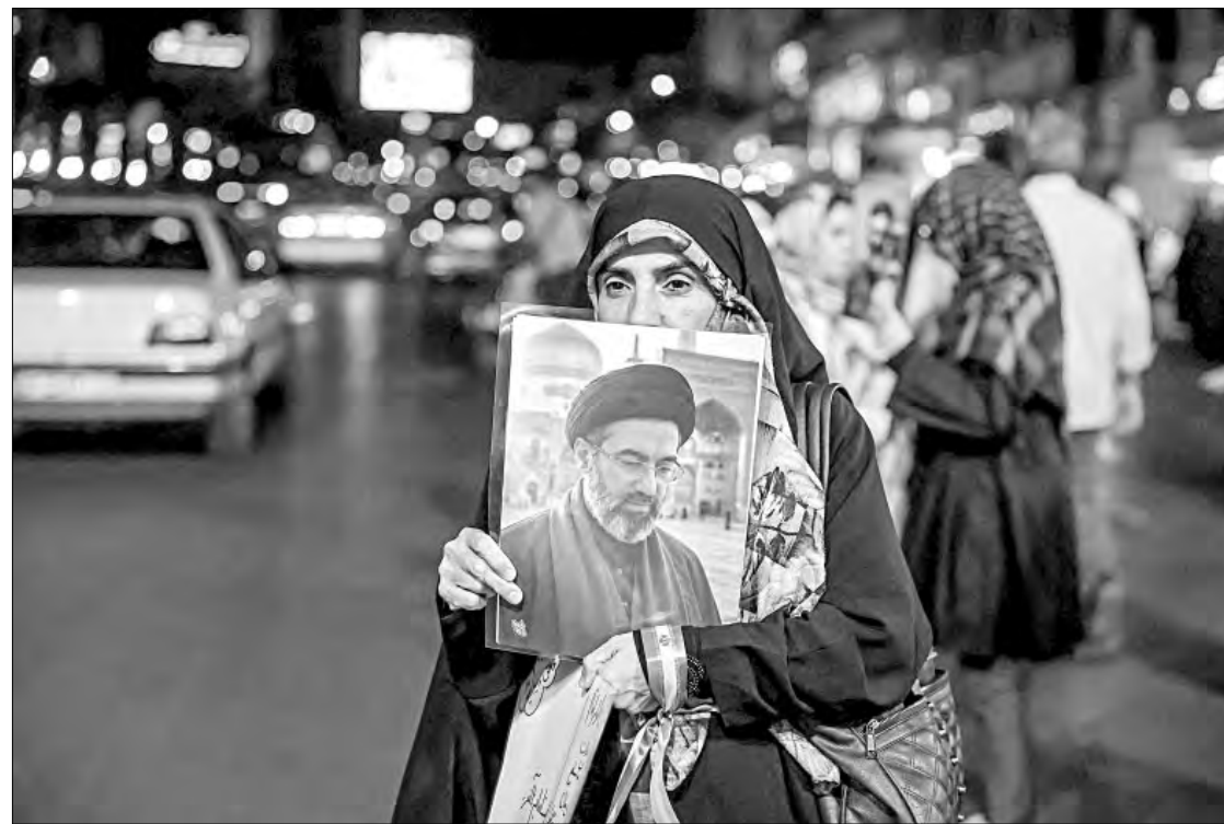
◀ Como ha ocurrido desde el comienzo del alto el fuego entre Irán y Estados Unidos, habitantes de Teherán realizaron ayer otra muestra de respaldo a su máximo dirigente, Mojtaba Jamenei.

El medio también reportó que los estadounidenses se negaron a liberar “ni siquiera 25 por ciento” de