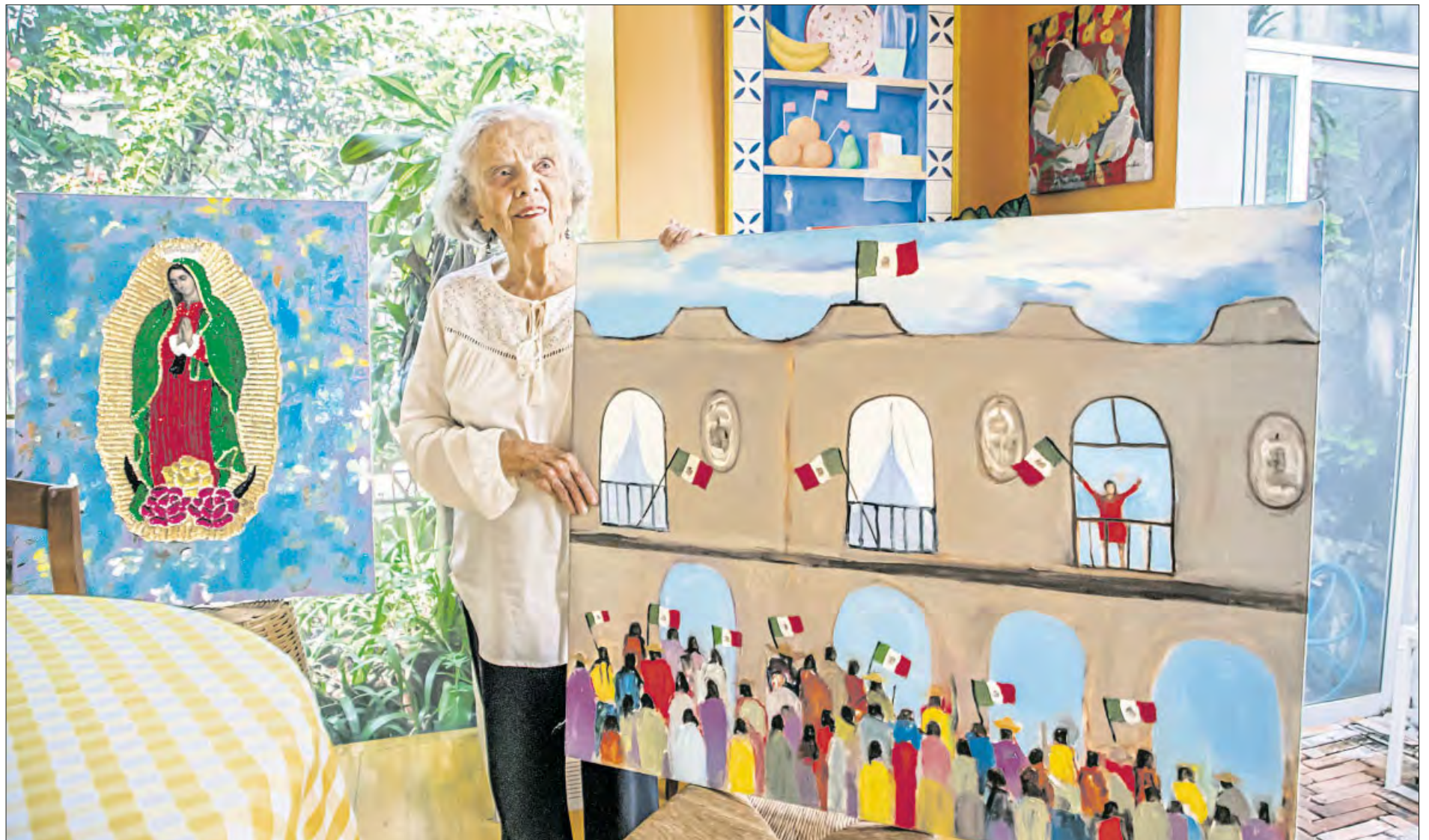
▲ Además de escribir y entrevistar, Poniatowska disfruta pintar. En la imagen sostiene un cuadro en el que se observa a la presidenta Claudia Sheinbaum Pardo festejando

Lamento que numerosos acervos literarios terminaran en Estados Unidos