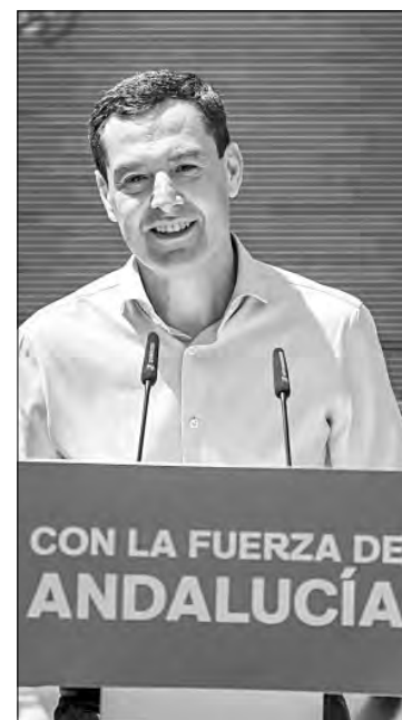
▲ Juan Manuel Moreno, del Partido Popular, gobernará cuatro años más Andalucía, el principal nicho electoral en España.

Adelante Andalucía celebró a lo grande sus resultados, ya que fue la clave para que el PP perdiera su mayoría absoluta. Además logró quitar