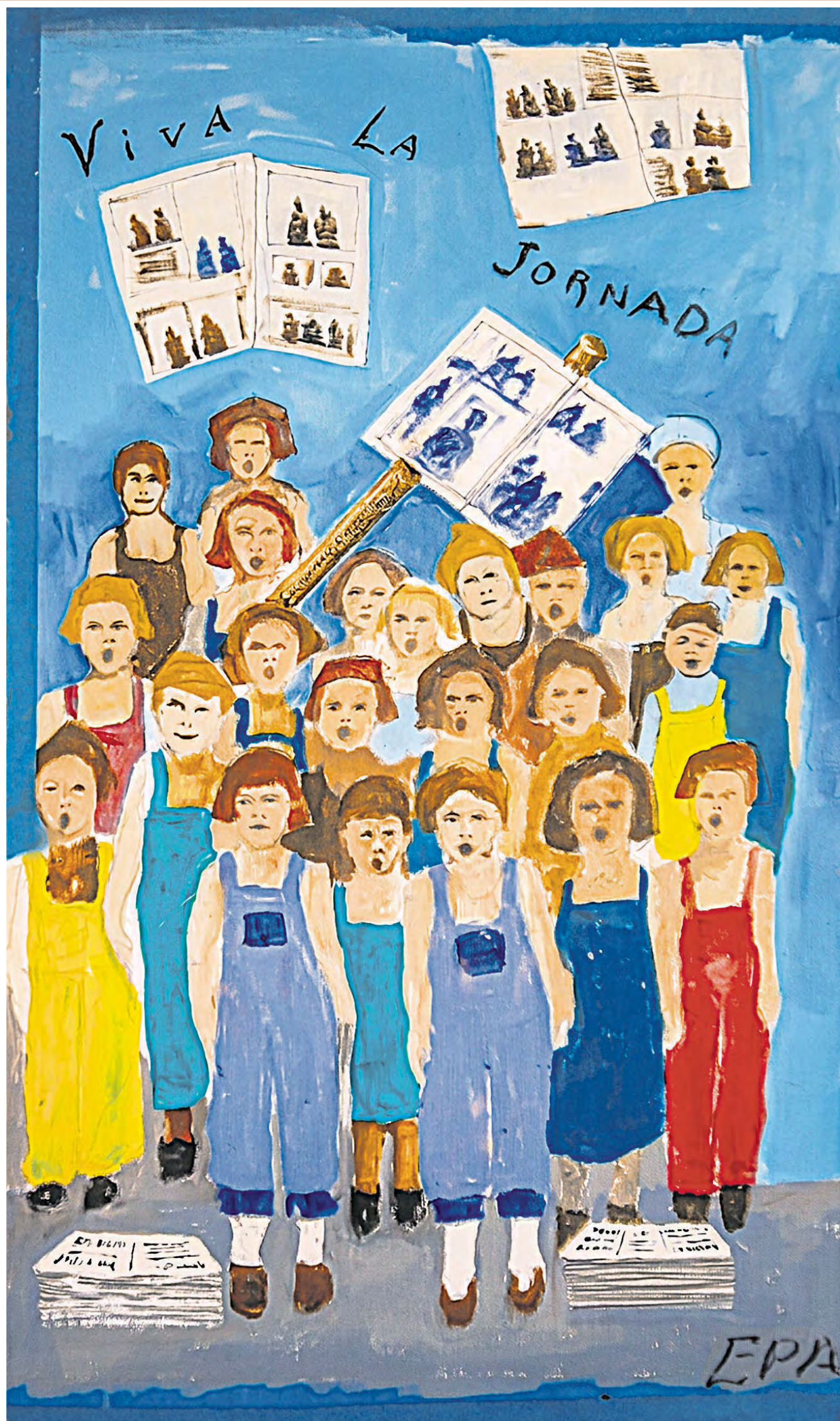
LA PERIODISTA Y escritora Elena Poniatowska Amor cumple 94 años este martes. Además de entrevistar y participar en conversatorios sobre los intelectuales mexicanos del siglo XX, le gusta pintar, bailar, hacer ganchillo y remendar calcetines. Las paredes de su casa, en el sur de la Ciudad de México, exhiben cientos de libros y numerosos cuadros salidos de sus pinceles, como esta obra, en la que celebra a su casa editorial. CULTURA / P 2a y 3a