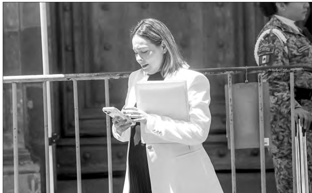
▲ Yeraldine Bonilla Valverde, gobernadora interina de Sinaloa, a su salida de Palacio

DE CONFIRMARSE QUE será un testigo cooperante, la capitulación del general golpearía a las fuerzas armadas y al gobierno mexicano en general. Un ejemplo se dio de inmediato en Sinaloa, donde la gobernadora interina, la morenista Yeraldine Bonilla Valverde, señaló que el nombramiento del general Mérida Sánchez "no fue una decisión del gobernador con licencia, sino una decisión de la propia Sedena, que lo envía al estado de Sinaloa como secretario de Seguridad Pública del Estado". En Zacatecas, según nota de Alfredo Valadez, corresponsal de La Jornada , la Sedena removió a un general de brigada, comandante de una zona militar, por versiones de que ha favorecido a un grupo criminal ( https://goo.su/DW1ag ).