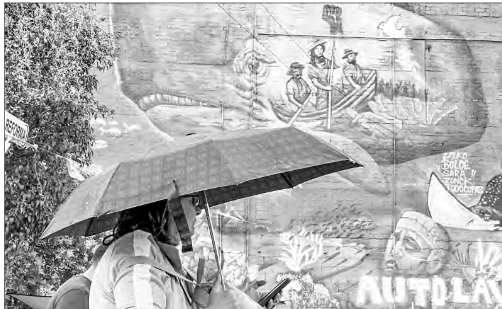
▲ Mujer previsora, por si pega duro el Sol o por si la agarra la lluvia.