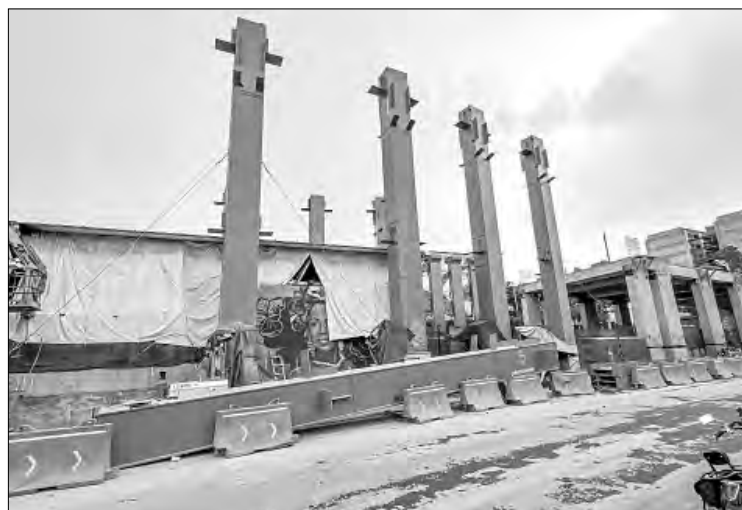
▲ En la también llamada calzada flotante, que conectará la plaza Tlaxcoaque con la estación Chabacano del Metro y que está proyectada como un corredor peatonal elevado, continúan las labores.

“Cuando el mundo llegue a la Ciudad de México en 2028, encontrará una ciudad abierta, solidaria y comprometida con demostrar que otro futuro urbano es posible”, concluyó.