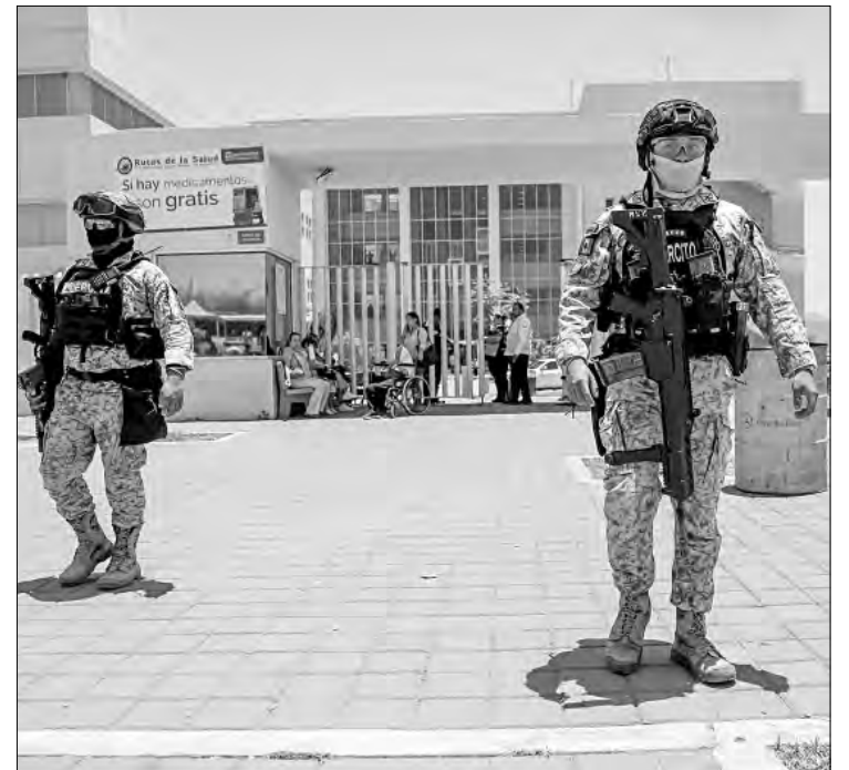
▲ Luego de ejecuciones dentro del Hospital General Dr. Bernardo J. Gastélum de IMSS-Bienestar, se habilitó una zona exclusiva para atender a los heridos por armas de fuego.