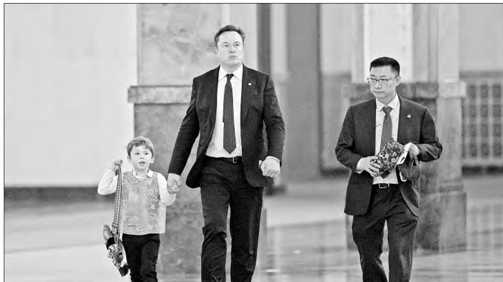
▲ Elon Musk visitó China e incendió las redes con una polémica declaración.

X, Facebook, TikTok, Instagram: galvanochoa Correo: galvanochoa@gmail.com