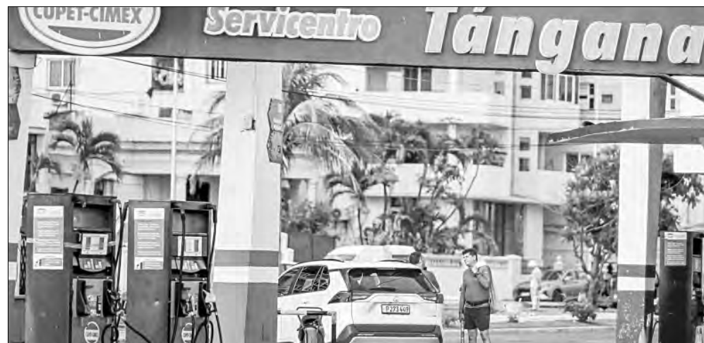
▲ Cuba aún cuenta con combustible en sus gasolineras, pero dado el alto precio por la

Twitter: @cafevega cfvmexico_sa@hotmail.com