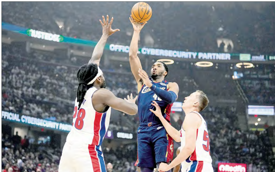
▲ Donovan Mitchell (al centro) igualó un récord de playoffs de la NBA con 39 puntos en la segunda mitad y los Cavaliers de Cleveland empataron su serie de segunda ronda contra los Pistones de Detroit con una victoria de 112-103. Mitchell terminó

con 43 puntos, incluyendo 15 durante la racha de 24-0 de Cleveland, que se extendió desde los últimos 12 segundos de la primera mitad hasta los primeros seis minutos del tercer cuarto. El quinto partido se jugará el miércoles por la noche en Detroit.