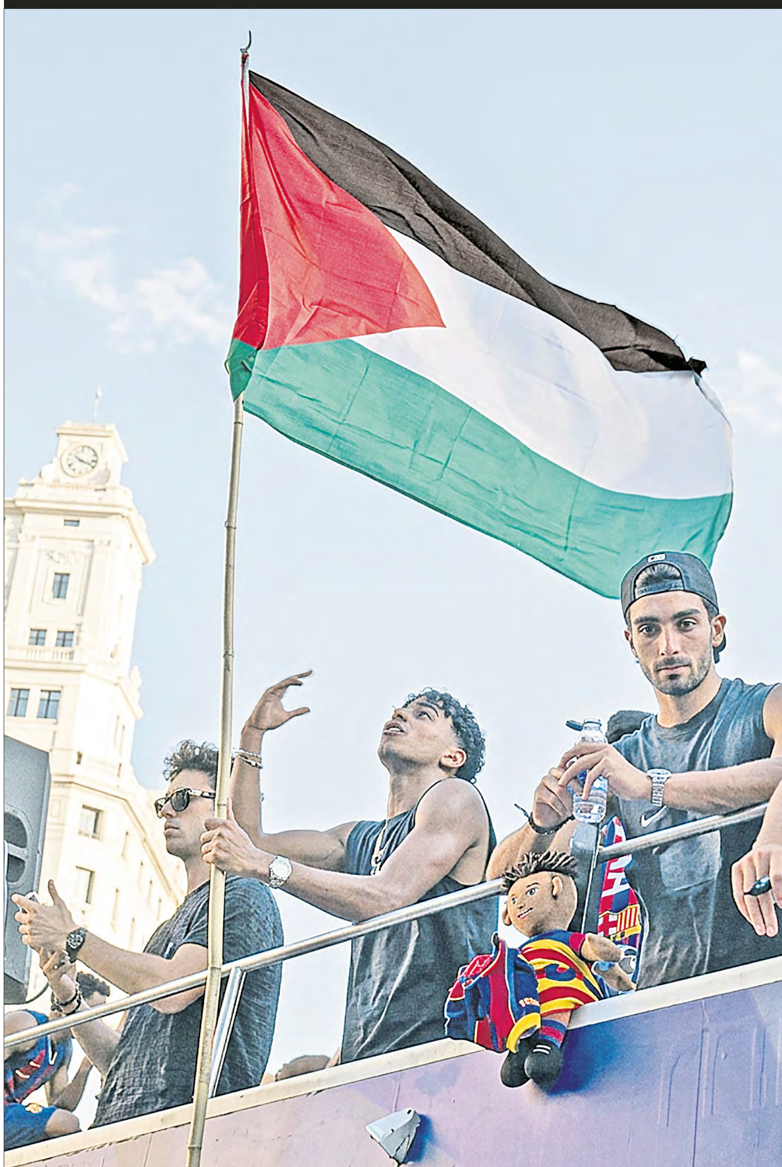
LAMINE YAMAL, HIJO de migrantes, ondeó la bandera de Palestina desde lo alto del camión del Barcelona durante el desfile de celebración por su título 29 de la liga española. En tiempos en los que cada vez son menos los futbolistas en pronunciarse en temas políticos, el joven de 18 años mostró su apoyo simbólico con el pueblo palestino, que sufre el genocidio que perpetró Israel en la franja de Gaza. Captura de pantalla