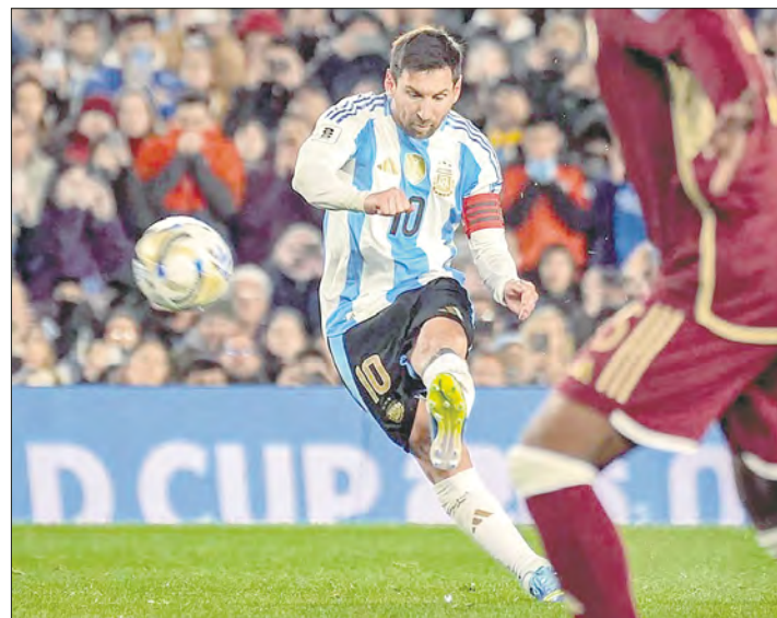
▲ Lionel Messi encabeza la prelista de 55 jugadores de la albiceleste. La Pulga debutó en el Mundial de Alemania 2006, por lo que sería el primer argentino en jugar seis Copas.