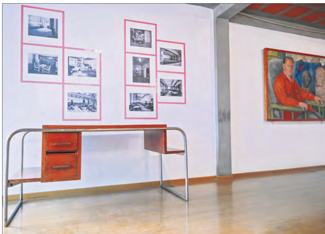
▲ La muestra incluye dos sillones, un perchero y un escritorio originales; el resto del mobiliario fue recreado por el Taller Nacional.

La exposición estará abierta al público hasta el primero de noviembre en el Museo Casa Estudio Diego Rivera y Frida Kahlo (calle Diego Rivera s/n, colonia San Ángel Inn). Martes a domingo de 10 a 17:30 horas.