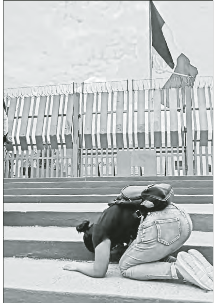
▲ Una habitante originaria de la Montaña Baja de Guerrero imploró la intervención de las autoridades, ayer frente al palacio de gobierno en Chilpancingo, ante la situación de los desplazados por la violencia de grupos criminales contra tres comunidades de Chilapa de Álvarez.

Las jóvenes denunciaron que “el gobierno no nos hace caso, fueron el jueves, hay fotografías de ellos circulando con las camionetas, pero se regresaron. Yo quisiera estar allá con ellos. Me siento inú-