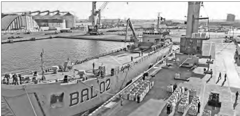
▲ Desde que comenzó el bloqueo a Cuba, en 1962, México siempre lo ha rechazado, y ya

Twitter: @cafevega cfvmexico_sa@hotmail.com