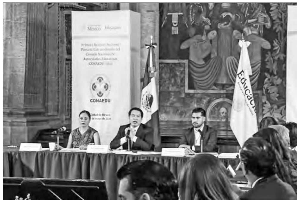
▲ El titular de la Secretaría de Educación Pública, Mario Delgado, quien reculó ayer del anuncio hecho el jueves de recortar el

EL SECRETARIO DE Educación Pública, ha de recordarse, forma parte de las “quinielas” que con más constancia se mencionan en relación con posibles acciones de Estados Unidos contra políticos mexicanos. Ahora, en el marco del más reciente tropiezo que ha tenido, con el fallido recorte al calendario escolar, se le menciona como posible aspirante a la candidatura de Morena al gobierno de Colima (una vía para zafarlo del gabinete). Habrá de verse si un enfilamiento así, hacia los delicados terrenos de Manzanillo y sus embarques recibidos, ayudará a la 4T a ahuyentar el aleteo siniestro de las acusaciones que provienen del norte y han tenido una primera concreción con Rubén Rocha Moya. ¡Hasta mañana!