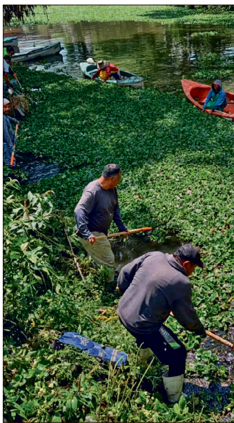
▲ El ayuntamiento espera la llegada de investigadores para capacitar a una cuadrilla en el manejo adecuado del lirio; descartan uso de maquinaria.

En este sentido, la presidenta municipal manifestó que esperan la llegada de investigadores de la UAM para capacitar a una cuadrilla en el manejo adecuado del lirio y sostener la estrategia mediante el uso de redes de contención.