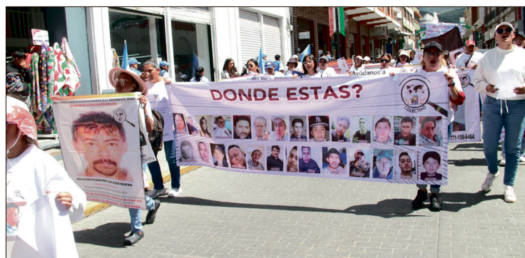
▲ El convenio establece lineamientos financieros específicos para asegurar la transparencia y el flujo de los fondos.

En primer lugar, el gobierno de Hidalgo dispone de un plazo de 20 días hábiles, contados a partir de la recepción de la primera ministración federal, para depositar la coparticipación de 4 millones de pesos en una cuenta bancaria pro-