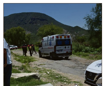
▲ Los hechos ocurrieron en la zona conocida como El Frontón, donde fue localizada Guadalupe “N”, joven que presentaba visibles signos de violencia.

Al sitio arribaron paramédicos de Protección Civil, así como agentes investigadores y personal de Servicios Periciales de la PGJEH, quienes realizaron las diligencias correspondientes para integrar la carpeta de investigación. La investigación se desarrolla bajo el protocolo de feminicidio.