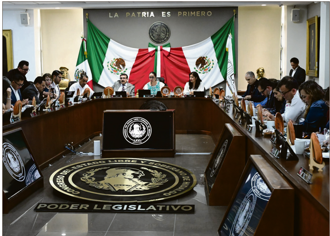
▲ Legisladores aprobaron el dictamen que reforma diversas disposiciones de la Constitución local en materias de austeridad presupuestaria y administrativa, igualdad sustantiva y paridad de género.

Asimismo, en el ámbito de la austeridad administrativa, la iniciativa prevé la prohibición expresa para que las consejerías del Instituto Estatal Electoral (IEEH) y los magistrados del Tribunal Electoral del Estado de Hidalgo (TEEH) contraten, con cargo a recursos públicos, seguros de gastos médicos pri-