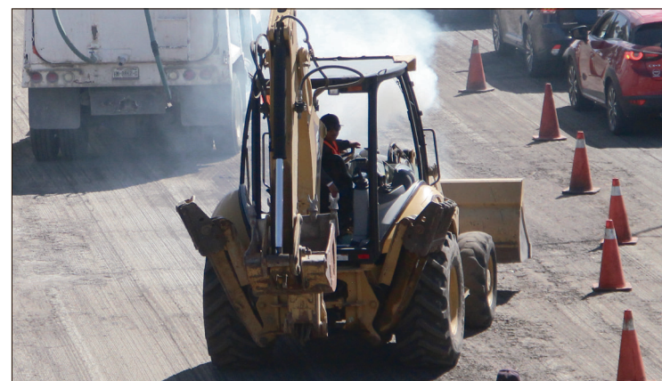
▲ El proyecto iniciará con los trabajos preliminares que implican el retiro de la carpeta asfáltica dañada, junto con el trazo y nivelación de la vialidad.

Posteriormente, se dará paso al movimiento de tierras con las terracerías correspondientes, para luego intervenir la infraestructura subterránea mediante la colocación de bocas de tormenta y la rehabilitación integral del drenaje sanitario y pluvial.