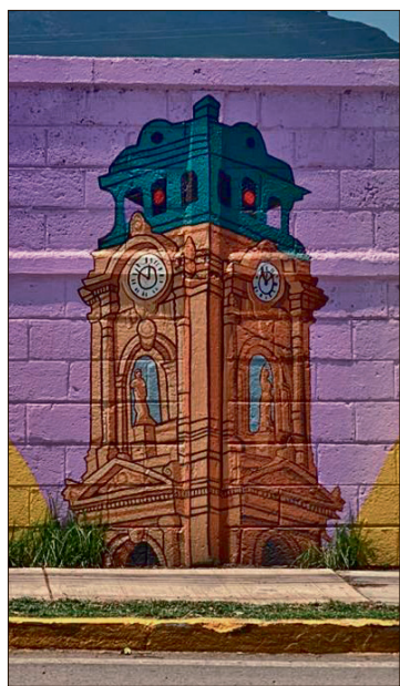
▲ Cada pieza cuenta con una superficie mínima de 10 metros cuadrados y fueron elaborados por artistas originarios de los municipios o regiones participantes.

Naranjo Baltazar destacó que la Copa Mundial de la FIFA 2026, que se desarrollará del 11 de junio al 19 de julio, será uno de los acontecimientos internacionales más importantes de la década, por lo que Hidalgo decidió sumarse a la estrategia nacional con una propuesta cultural que dejará un legado