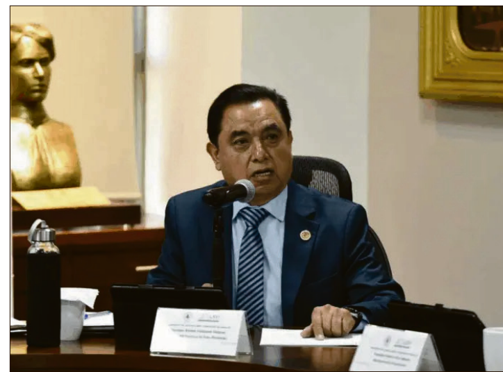
▲ El presidente de la Junta de Gobierno explicó que en su momento se irán evaluando temas como el recurso, su alcance, entre otras cuestiones que fueron observadas.