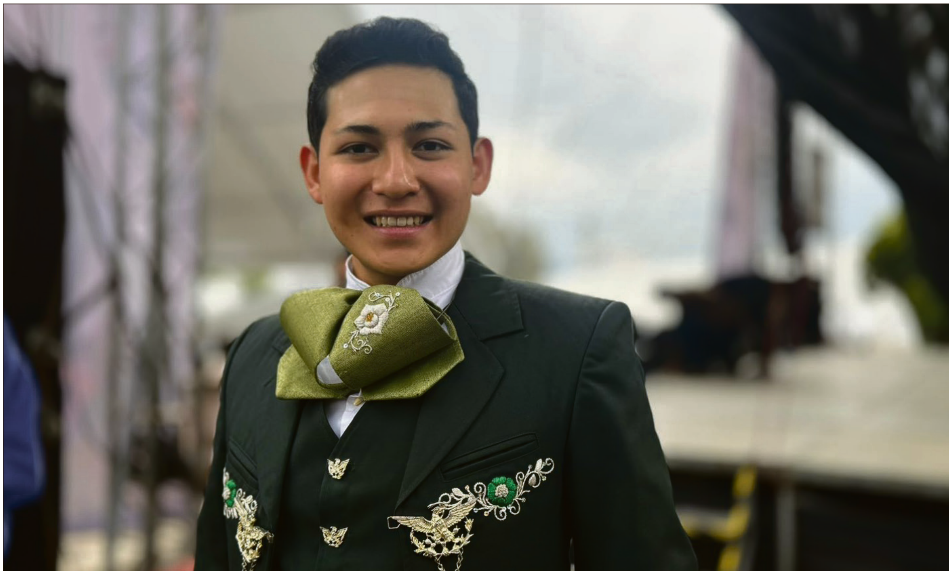
▲ Originario de Tula de Allende, el cantante, actor de doblaje y compositor de 21 años aseguró que su pasión por la música comenzó desde antes de nacer.

LA MÚSICA REGIONAL MEXICANA ES LO QUE MÁS LE APASIONA