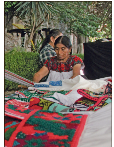
▲ Premiarán la identidad, la tradición y la cosmovisión que hay detrás de cada pieza.

El jurado estará integrado por representantes del gobierno de Hidalgo, instituciones federales y la Federación Mexicana de Futbol, organismo al que agradeció por colaborar en el desarrollo del proyecto.