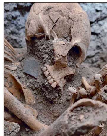
▲ Se han registrado más de una decena de enterramientos colectivos e individuales.

Además de que no es la única, explicó, ya que en la zona norte de Tula hay múltiples asentamientos del periodo Clásico (220-650 d. C.), como Chingú que servía de centro regional de expansión teotihuacana, y también están El Tesoro, Acoculco, el Llano y La Malinche.