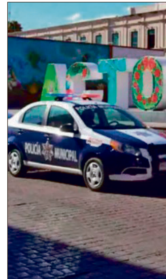
▲ De acuerdo con el reporte policial, los hechos ocurrieron alrededor de las 22:20 horas del domingo.