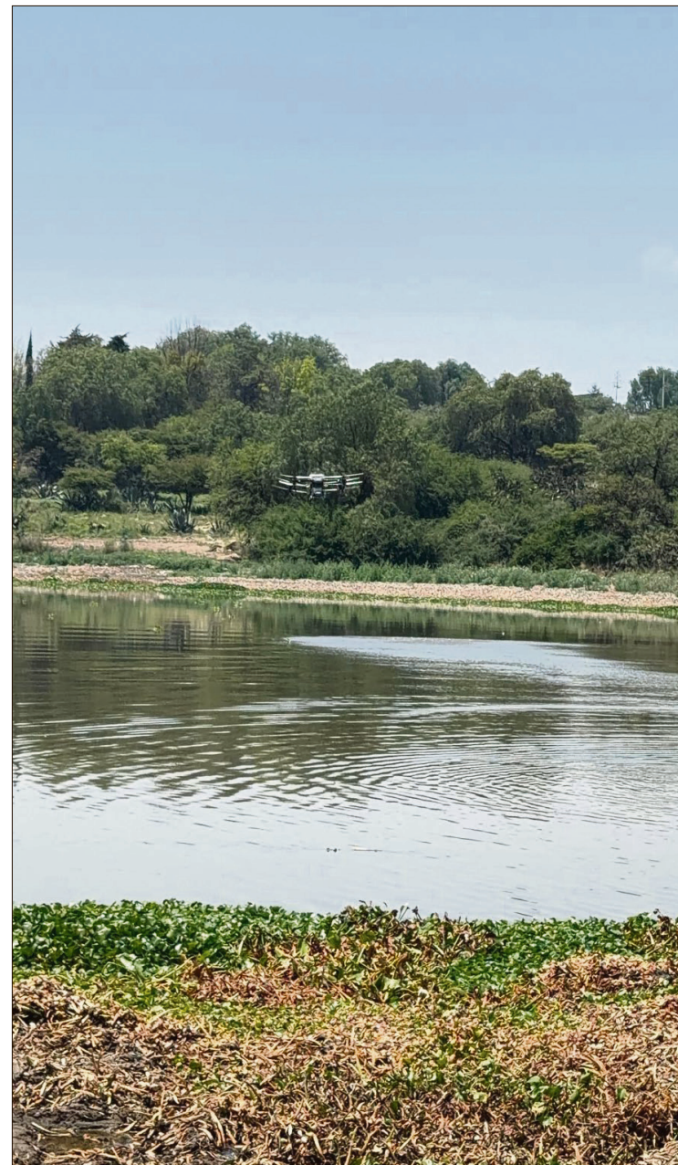
▲ El larvicida no muestra efectos tóxicos contra peces, aves, ganado, fauna benéfica, otros insectos ni contra los seres humanos.

Y, afirma la Conagua, el plan maestro incluye acciones que se revisaron, de acuerdo con experiencias internacionales de Alemania, Brasil, China, Estados Unidos, España, India, Japón y Países Bajos para incorporar evidencia técnica y evitar errores previos en el tratamiento del problema del lirio acuático y combate al mosco Culex.