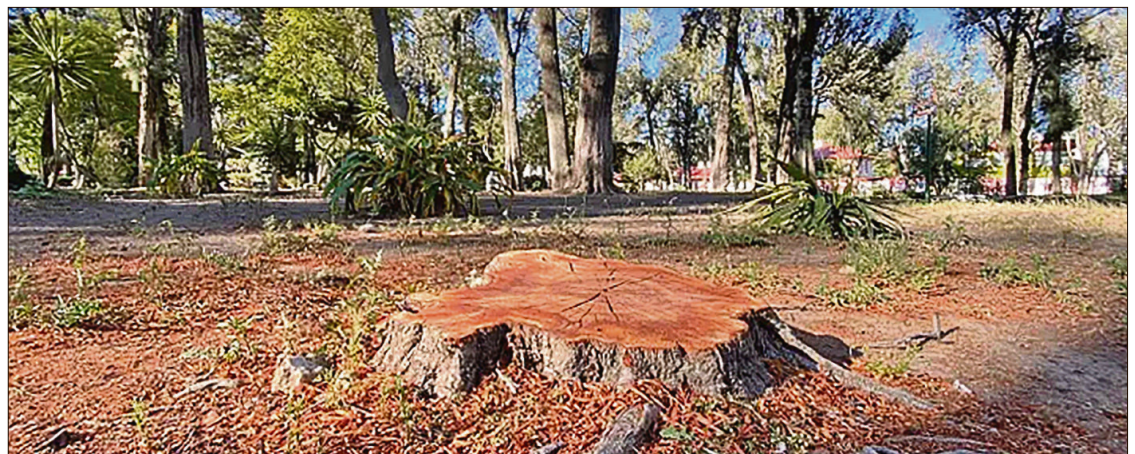
▲ Hidalgo figura entre las diez demarcaciones con mayor superficie afectada en territorio nacional, acumulando 324.9 hectáreas dañadas.

meros tres meses del año. La problemática se concentra severamente en diez estados que, en conjunto, suman 10 mil 563.9 hectáreas afectadas; es decir, 81.6% del total nacional.