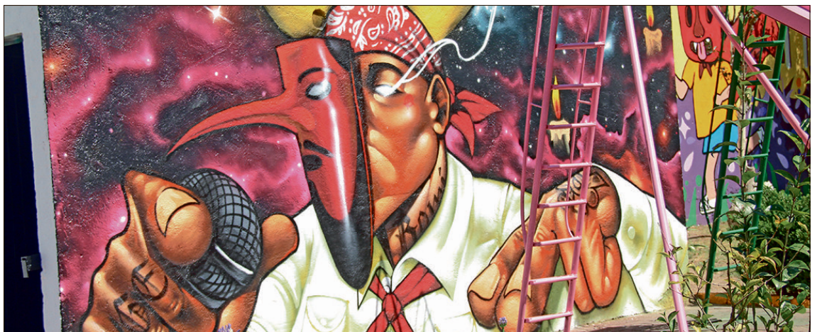
▲ Entre trazos, formas y colores, han dado vida a lugares que antes estaban vandalizados y olvidados, convirtiéndolos hoy en muestras de arte al aire libre.