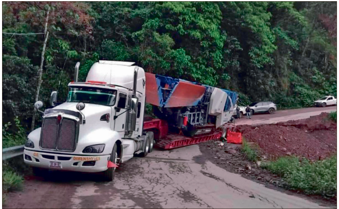
▲ Fue el miércoles cuando un tractocamión que transportaba maquinaria pesada quedó varado sobre la pequeña estructura.

Fue el miércoles cuando un tractocamión que transportaba maquinaria pesada quedó varado sobre la pequeña estructura. El remolque de la unidad permanece posicionado justo en el punto donde la cinta asfáltica y la base de tierra sufrieron un desprendimiento, dejando