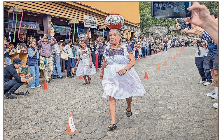
▲ Participan artistas, maestros artesanos, cocineros tradicionales, talleristas y productores locales.

La celebración continuará este domingo 10 de mayo con una