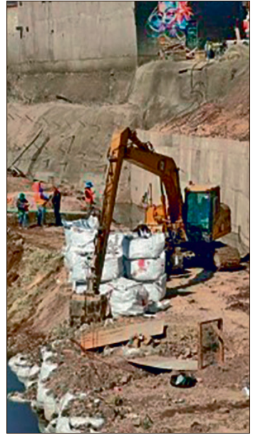
▲ La SIPDUS emitió dos convocatorias destinadas a la realización de estudios técnicos especializados en los afluentes.

Asimismo, se tiene previsto un periodo de ejecución de ocho meses, fijando el 25 de febrero de 2027 como la fecha estimada para la conclusión y entrega de los diagnósticos y proyectos finales a la secretaria.