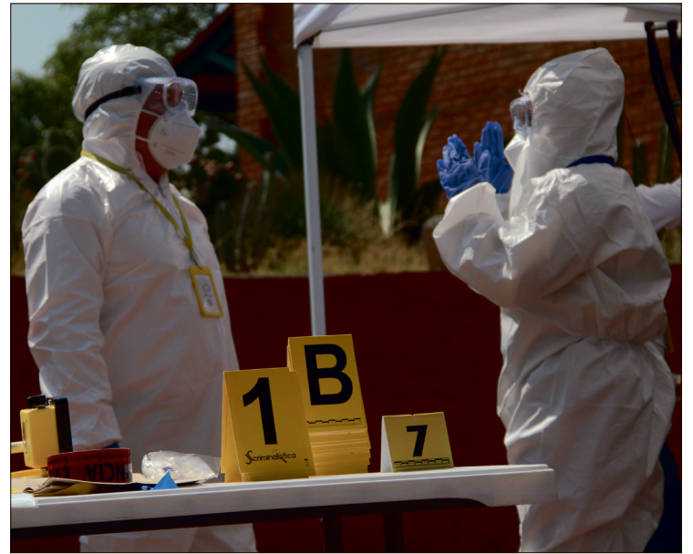
▲ En cuanto a delitos de alto impacto, el gobierno federal reportó reducciones en feminicidio.

Entre las entidades con mayores disminuciones en homicidio doloso se encuentran San Luis Potosí, con 80.8%; Zacatecas, con 61.8%; Quintana Roo, con 60.3%; Guanajuato, con 57%, y Nuevo León, con 50.8%.