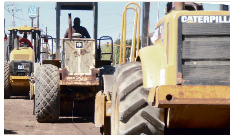
▲ El presupuesto asignado contempla obras de drenaje, proyectos de urbanización y la instalación de señalamiento.

Además de la superficie de rodadura, el presupuesto asignado contempla la ejecución de obras de drenaje, proyectos de urbanización