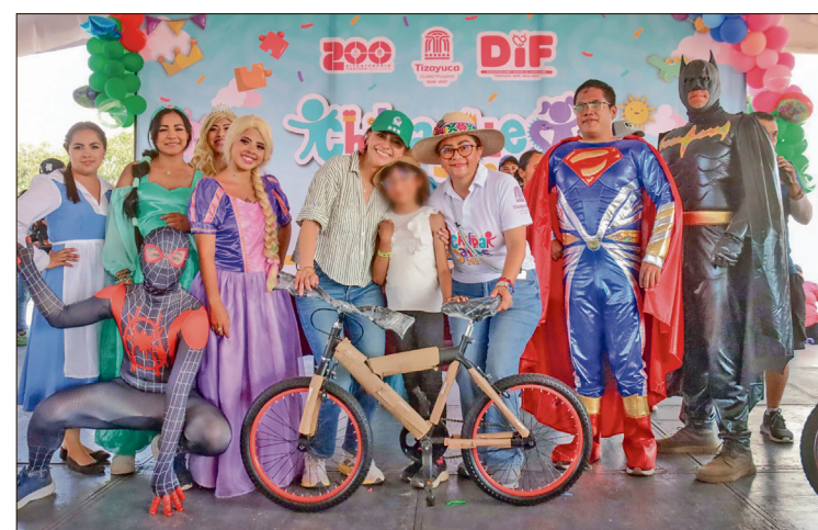
▲ El personal organizador cumplió con la meta de entregar un regalo conmemorativo a cada una de las niñas y los niños.

Estas opciones de entretenimiento físico fueron complementadas con spots fotográficos como el presentado por la Secretaría de Seguridad Ciudadana (SSC), además del programa artístico, que tuvo como puntos culminantes el show de payasos y la presentación estelar del espectáculo de Belí y Beto, logrando una interacción constante con el público.