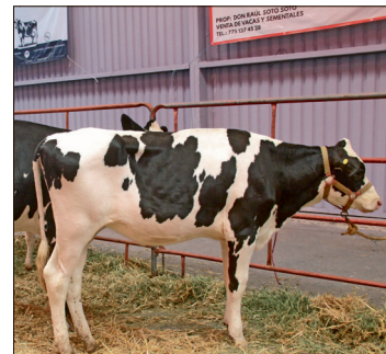
▲ La entidad se posiciona actualmente en el undécimo lugar con mayor incidencia de esta plaga a nivel nacional.

El informe técnico de Senasica detalla que, del universo de casos detectados, 125 se mantienen como focos activos, lo que requiere de una intervención inmediata por