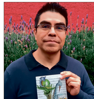
▲ Pangrama se presentará en la librería Octavio Paz del Fondo de Cultura Económica, en Miguel Ángel de Quevedo, en la Ciudad de México.

son intrascendentes”, explica, pero al analizarlos se expanden. El desempleo, por ejemplo, no es solo una circunstancia económica: es miedo, incertidumbre, transformación. Es también una pregunta sobre el sentido de la vida. “Nos quedamos desempleados emocional o intelectualmente también”, dice.