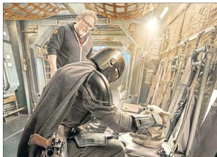
◀ El director Jon Favreau, izquierda, y Pedro Pascal en el rodaje de Star Wars: The Mandalorian and Grogu de Lucasfilm.

The Mandalorian siempre se sintió más cinematográfica que una serie de televisión promedio gracias a sus innovadores escenarios virtuales conocidos como el Volumen, pero la gran pantalla exige algo espectacular. Y resulta que más tiempo, espacio y dinero ayudan bastante a crear algo digno de la gran pantalla.