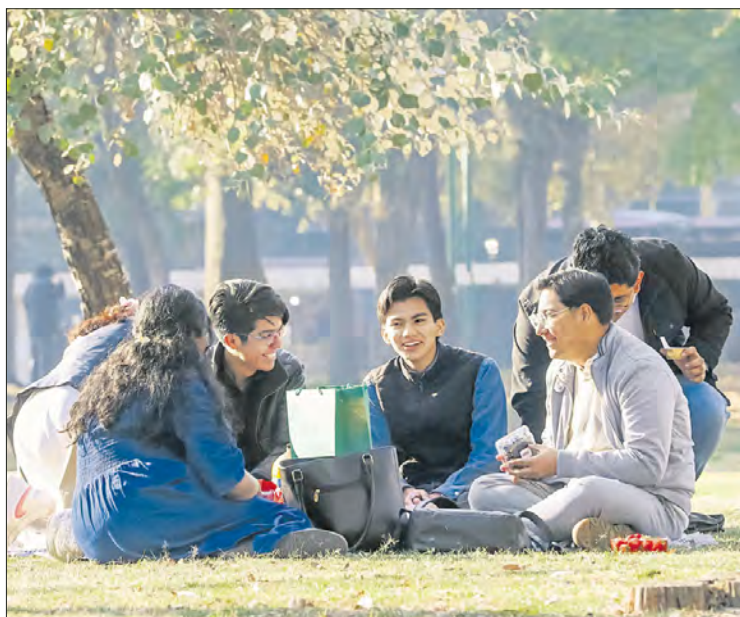
◀ Respecto a tener hijos, existe una tendencia descendente entre generaciones, de acuerdo con la encuesta.

El porcentaje de personas que reportaron una salud autopercebida como buena y muy buena presentó un incremento. En el total de la población, este porcentaje pasó de 49.4 en la cohorte 1961-1967 a 81 en la cohorte 1998-2007. En tanto, las que reportaron altos niveles de satisfacción (valores de 9 o 10) con la vida actual es similar entre cohortes mayores y más jóvenes, con 61.1 por ciento en la cohorte 1961-1968 y 63 por ciento en la de 1998-2007.