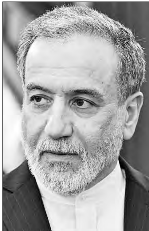
▲ Abbas Araghchi, ministro de Asuntos Exteriores de Irán, viajó a San Petersburgo para reunirse con el presidente ruso, Vladimir Putin.

http://alfredojalife.com • https://substack.com/@jaliferahme • https://www.patreon.com/alfredojalife • https://www.facebook.com/AlfredoJalife • https://vk.com/alfredojalifeoficial • https://t.me/AJalife • https://www.youtube.com/channel/UC1fxj0ThZDPL_c0Ld7psDsw?view_as=subscriber • https://vm.tiktok.com/ZM8KnkKQn/ • https://twitter.com/AlfredoJalife • @alfredojalifer