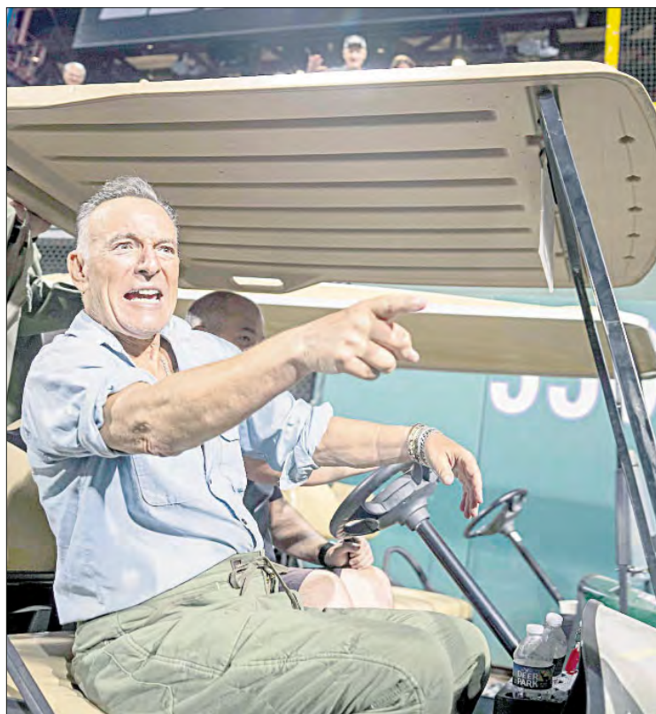
▲ El cantante estadounidense hace una oración de agradecimiento porque ni Trump "ni nadie de la administración ni de los asistentes resultó herido" al comenzar un concierto.

ten sobre el público: "no se supone que sea tan agresivo ni doloroso, pero la reacción física a nuestra música es interesante. Me gusta la forma en la que ese tipo de historias se expanden. Una vez en Francia alguien colapsó al lado de nuestro ingeniero de sonido, se lo llevaron en ambulancia, se peleó con los paramédicos y volvió al show sólo para desmayarse de vuelta. No me relaciono con esa historia desde una postura de poder, nuestros conciertos tratan sobre otro tipo de experiencia, con otra profundidad, aunque me gusta el mito".