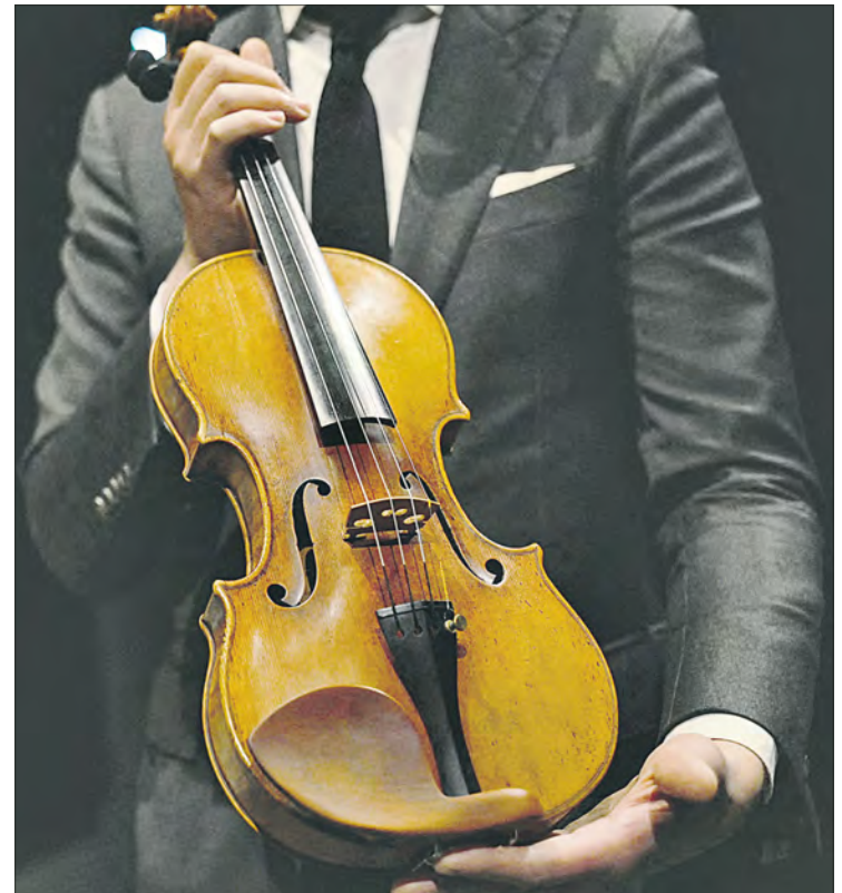
▲ Los violines Stradivarius alcanzan precios de varios millones de dólares en subastas, como el Joachim-Ma, en la imagen, que ofreció Sotheby's Nueva York en febrero del año pasado.