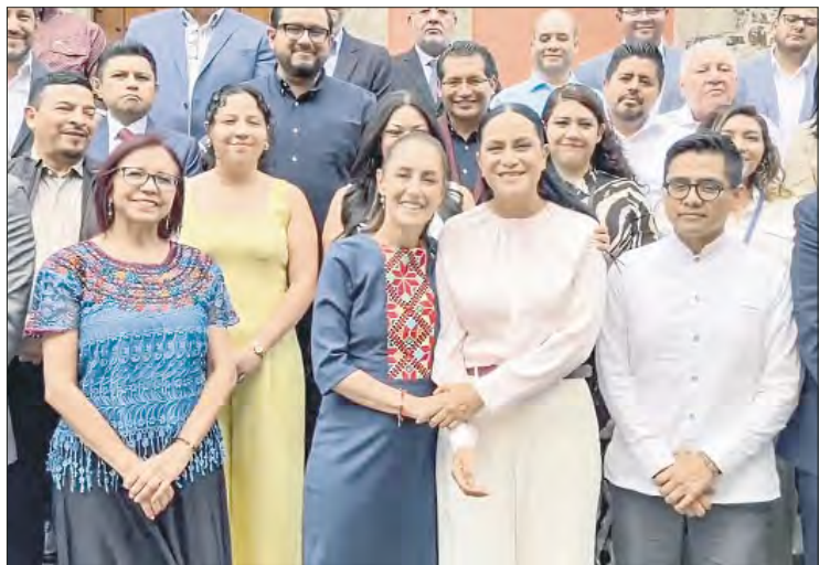
◀ Con un video que la Presidenta difundió anoche, se confirmó lo que era un secreto a voces sobre el próximo liderazgo en Morena.