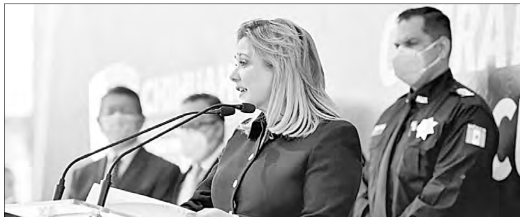
▲ La gobernadora de Chihuahua, María Eugenia Campos Galván, en octubre de 2021, durante una conferencia de prensa en la cual se refirió al

X: @cafevega Correo: cfvmexico_sa@hotmail.com