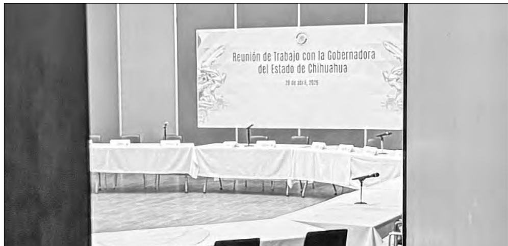
▲ La gobernadora de Chihuahua faltó ayer a la reunión de trabajo a que la convocó el