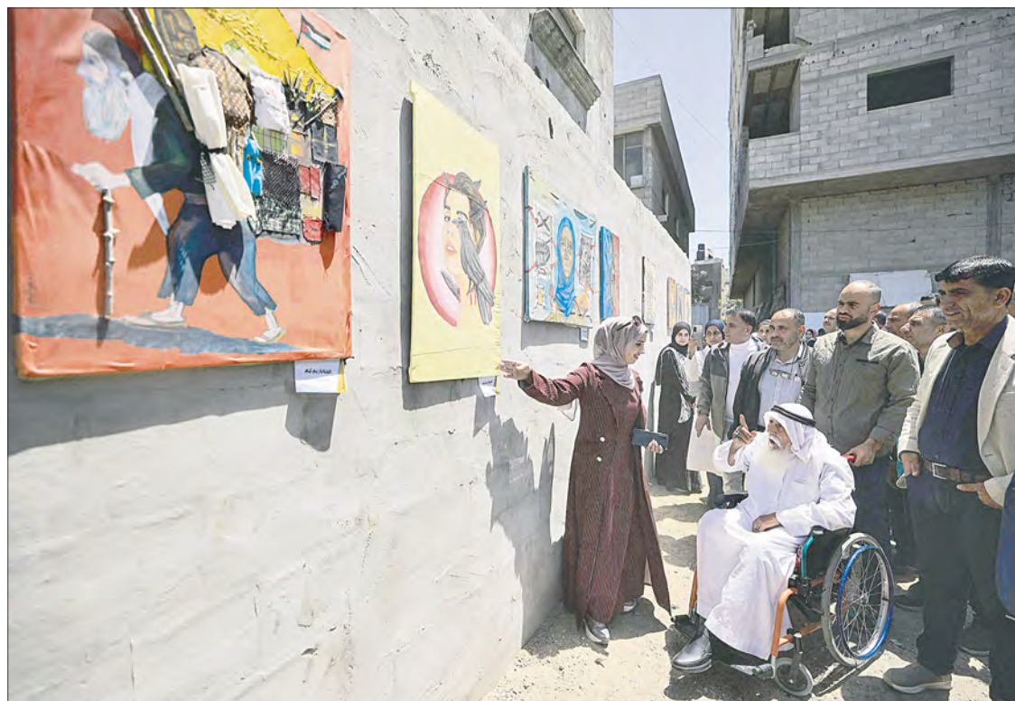
▲ Artistas palestinos hicieron una exposición improvisada para mostrar al mundo lo que ha ocurrido durante la guerra y el frágil alto el fuego. La hilera de pinturas se exhibe en las paredes del campamento de refugiados palestinos de Bureij, en el centro de la franja de Gaza.