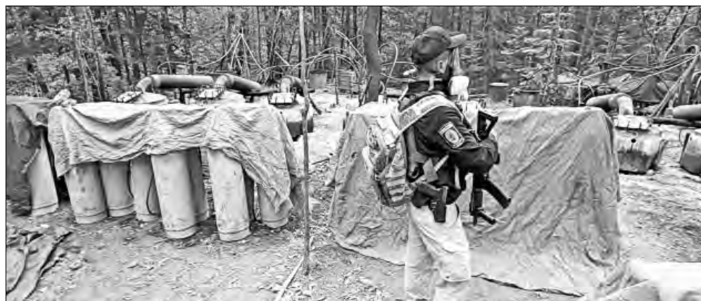
▲ Un operativo en Chihuahua destapó una colaboración ilegal.