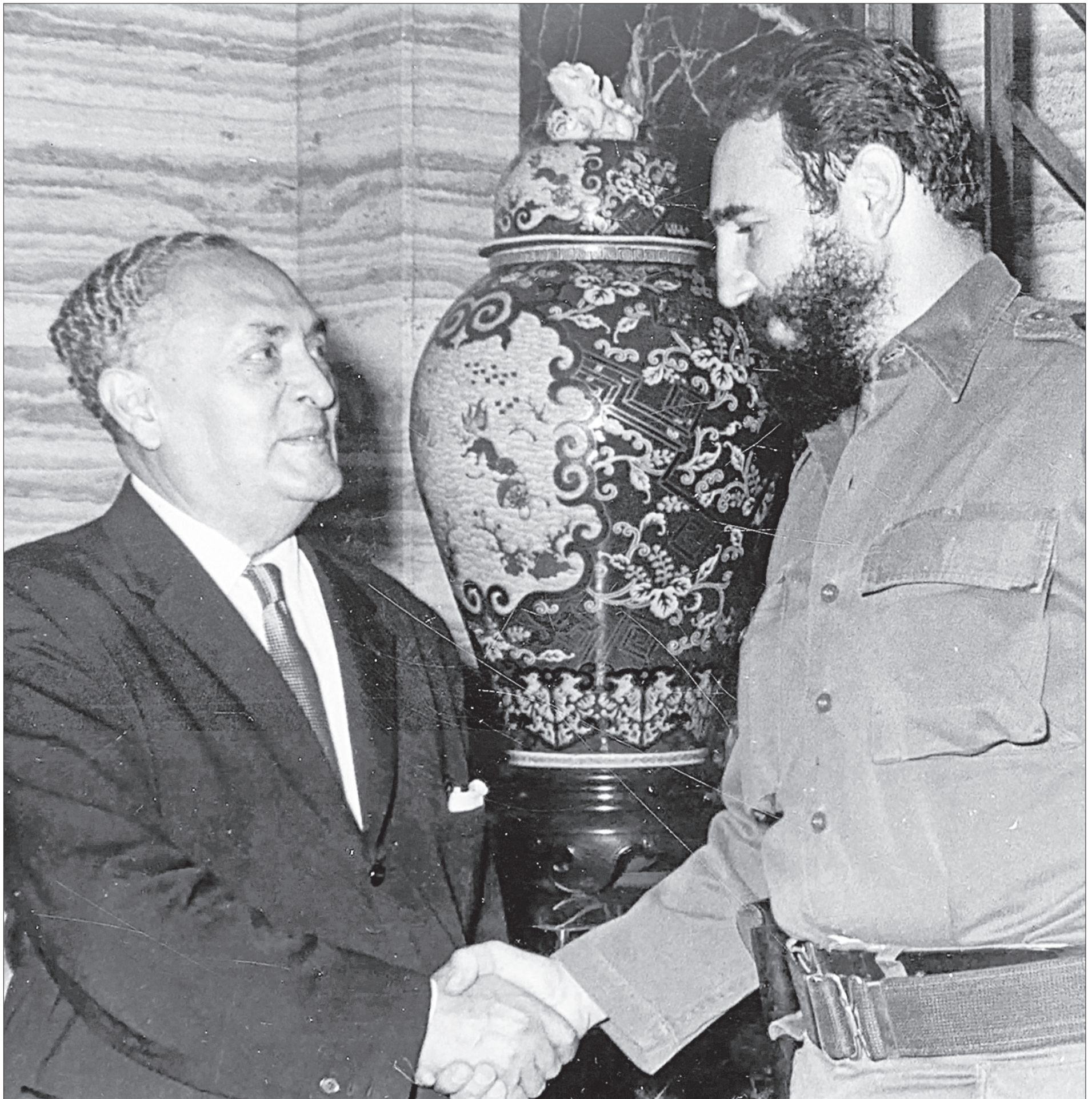
DURANTE 11 AÑOS , el diplomático mexicano Gilberto Bosques, embajador en Cuba durante los tiempos de la dictadura de Fulgencio Batista, protegió la vida de muchas personas amenazadas por ese régimen. En homenaje a su trayectoria, el actual embajador de México en la isla caribeña, Miguel Díaz Reynoso, presentó el documental Cuadernos de La Habana: Gilberto Bosques en Cuba , en el que recupera "las historias del gran Bosques". Foto cortesía Tv UNAM CULTURA / P 2a