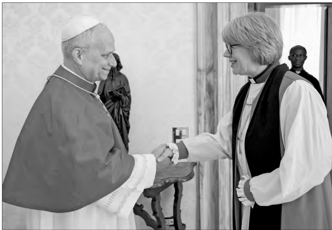
▲ León XIV oró ayer en el Vaticano con la arzobispa de Canterbury, Sarah Mullally, y prometió trabajar a fin de superar las diferencias "por intratables que puedan parecer", en un

encuentro histórico con la primera mujer al frente de la Iglesia de Inglaterra. Nota completa en @lajornada online: https://shorturl.at/XZLAR .