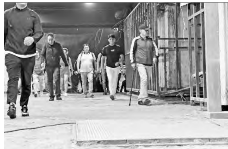
▲▼ La estación Bellas Artes de la línea 2 del Metro se encuentra prácticamente en obra negra, ya que no cuenta con piso de loseta, las paredes permanecen sin acabados, tiene escasa iluminación y trabajadores laboran en medio del ajetreo cotidiano que se produce en una de las estaciones más concurridas.