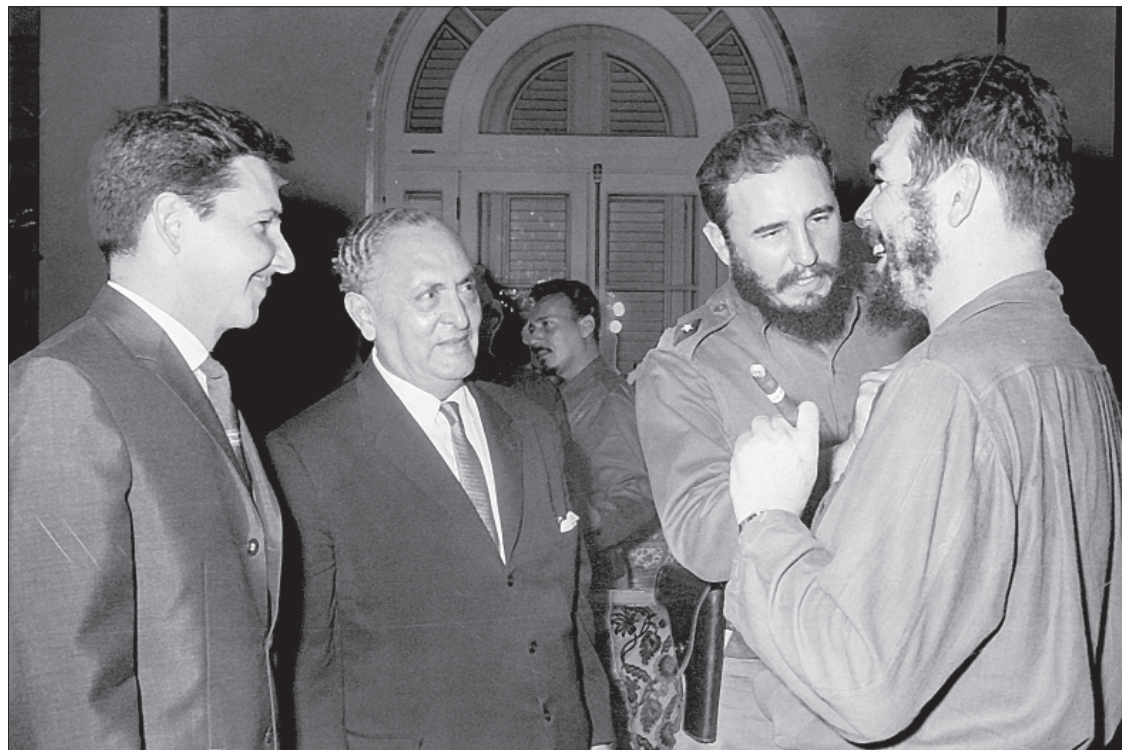
▲ En el documental se observan imágenes del diplomático Gilberto Bosques Saldívar junto con personalidades como los hermanos Raúl y Fidel Castro, y Ernesto Guevara.