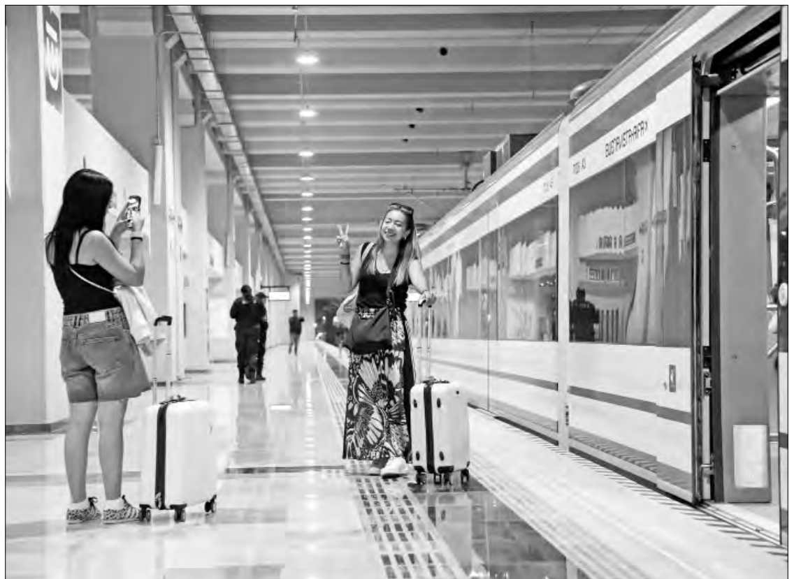
▲ En el primer día de operaciones del Tren Suburbano, los convoyes salían saturados desde el Aeropuerto Internacional Felipe Ángeles hacia

Antes del mediodía, el convoy de Buenavista al AIFA y de regreso recorrió las 12 estaciones con tiempos de entre 55 minutos y una hora. En el trayecto de ida no se llenaron todos los lugares, pero de regreso a la CDMX fue lo contrario, estuvo abarrotado y varios pasajeros viajaron de pie.