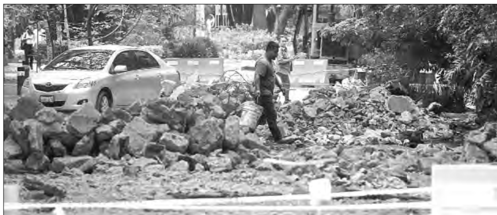
▲ A marchas forzadas continúan los trabajos de rencarpetamiento en la calle Ozuluama,