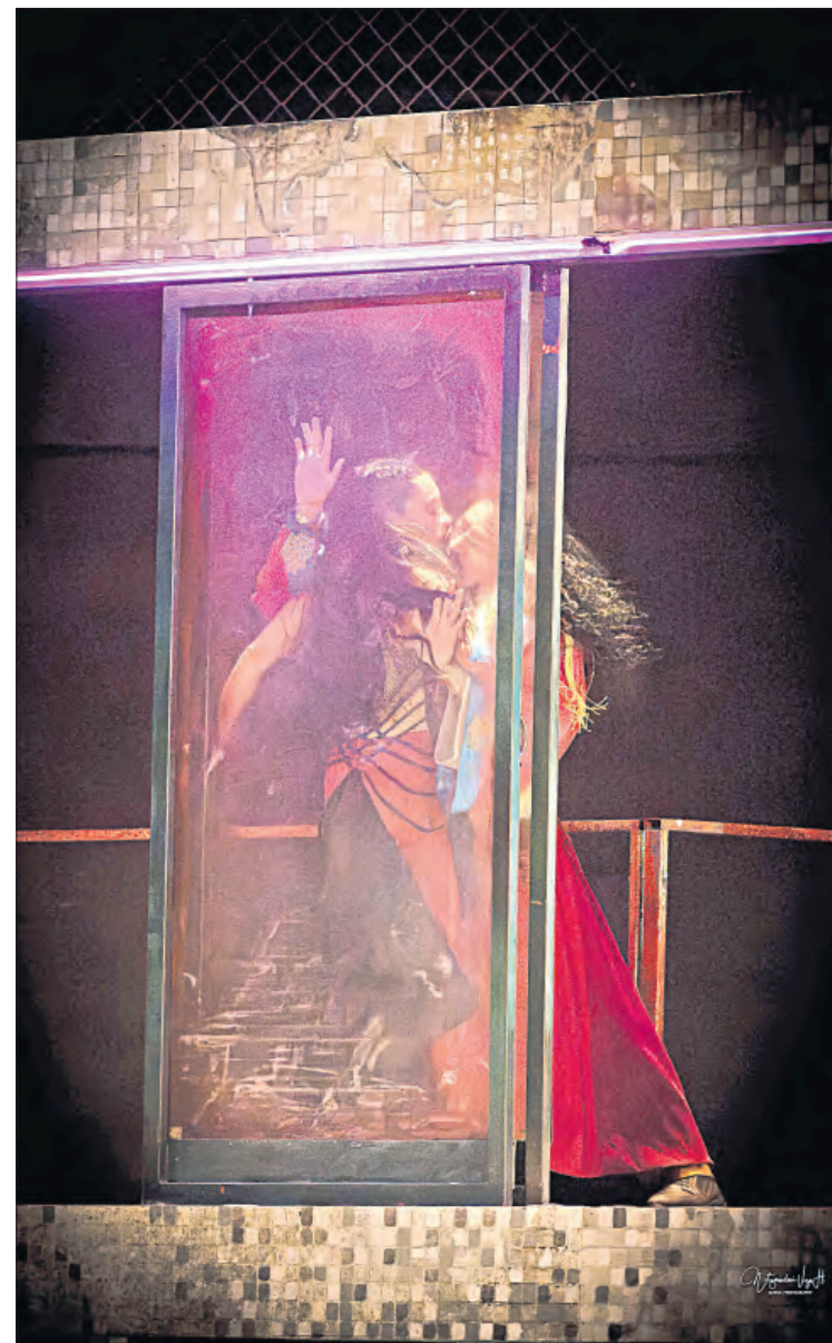
gráfico vinculado con la estructura musical, distinguiéndose por una construcción del movimiento que dialoga directamente con la arquitectura sonora.