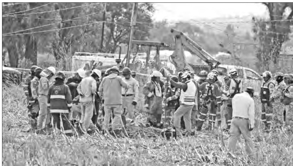
▲ Autoridades federales y estatales aseguraron un túnel con una toma clandestina de hidrocarburo en el que murieron cuatro personas por intoxicación con gases.