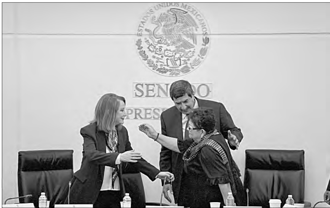
▲ La fiscal general de la República, Ernestina Godoy (derecha), compareció ayer ante la Comisión de Justicia del Senado. La acompañan Laura Itzel Castillo y Javier Corral.

La fiscal manifestó preocupación por las "cifras negras" que se registran, por lo que apuntó que la actua-