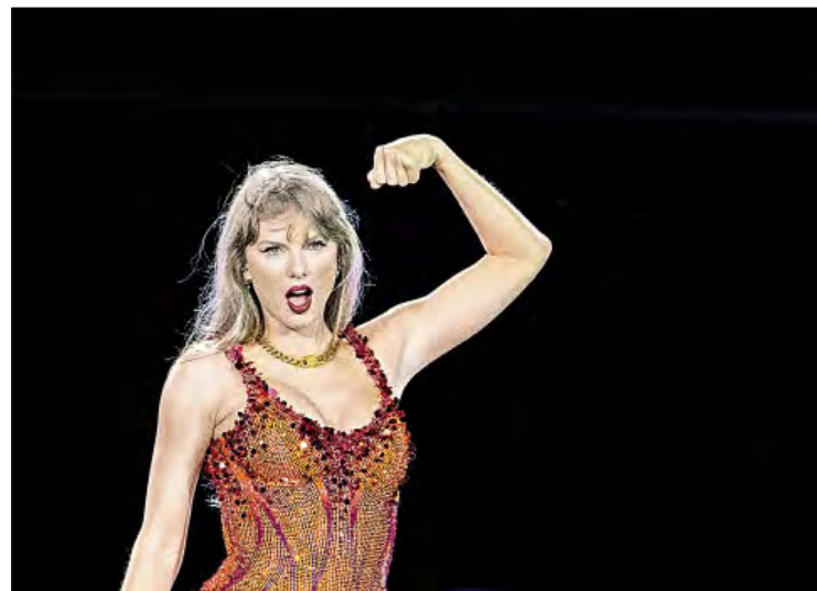
▲ En septiembre de 2024, Taylor Swift condenó una publicación en la página web de la campaña de Donald Trump, donde una imagen falsa de ella supuestamente pedía respaldar al republicano. Ese episodio acrecentó los miedos de la estrella sobre la IA y los peligros de divulgar desinformación.

El ejemplo más notable es el de Scarlett Johansson, quien en 2023 demandó a la aplicación Lisa AI por crear, sin su consentimiento, un avatar similar a ella con fines publicitarios.