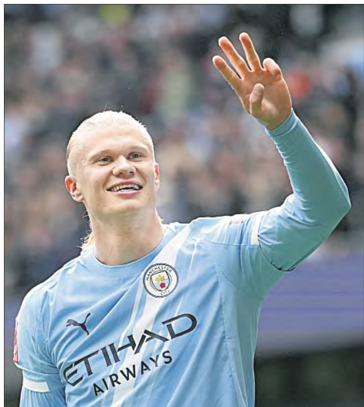
▲ El noruego Erling Haaland brilló ayer al anotar un triplete en la victoria por 4-0 de los Citizens sobre los Reds.