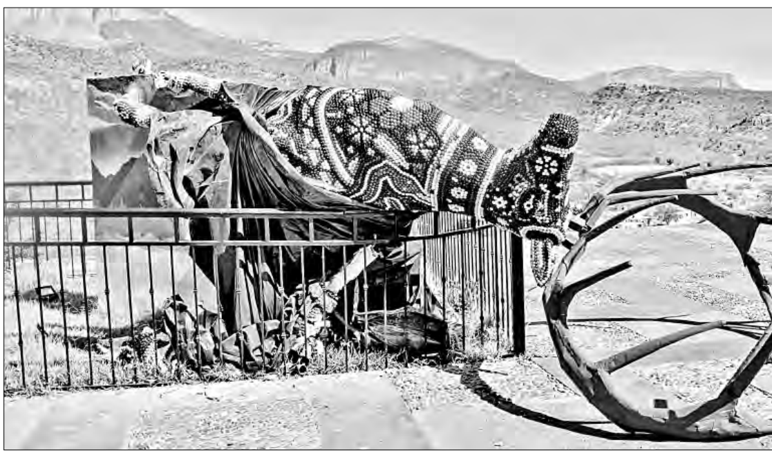
◀ Derribaron la figura del venado, que para el pueblo wixárika simboliza la presencia de sus comunidades en el noroeste de Jalisco.

El gobernador Pablo Lemus, en medio de la tensión, que incluye la prohibición de entrada o paso a los wixaritari por la cabecera municipal, dijo que “los ánimos entre mestizos