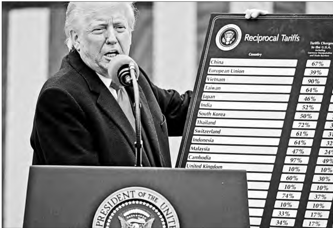
◀ El presidente de Estados Unidos, Donald Trump, durante la presentación de aranceles a numerosos países en un acto denominado "Hagamos a Estados Unidos rico otra vez", el 2 de abril del año pasado en la Rosaleda de la Casa Blanca.

De acuerdo con la Oficina del Censo del Departamento de Comercio de Estados Unidos, entre enero y febrero de este año el comercio total entre ambos países ascendió a 147 mil 322 millones de dólares, por encima de los 138 mil millones re-