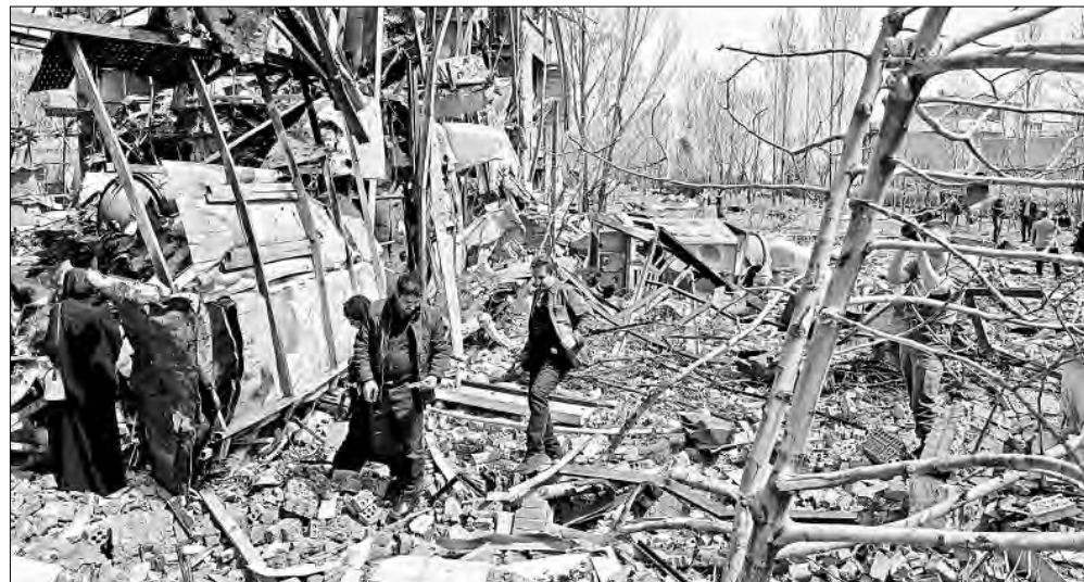
▲ La Universidad Shahid Beheshti, en Teherán, sufrió ataques de EU e Israel. Más de

EL CILINDRO DE Ciro enarbola “la justicia