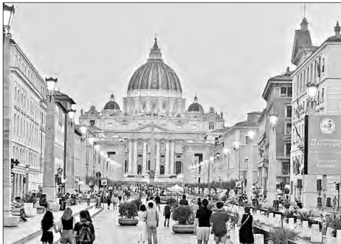
▲ El acceso cuesta 20 dólares para lo cual se tiene que reservar en línea con semanas de antelación.

REALIZADA CUANDO EL artista contaba sólo con 24 años, la estatua de La Piedad representa a la Virgen María sosteniendo el cuerpo sin vida de Jesús y reúne al mayor número de visitantes. Los frescos de la Capilla Sixtina son también obra de este genio italiano. Alia Lira Hartmann