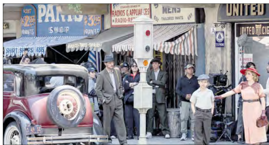
▲ El actor chileno, Pedro Pascal, filma escenas de su nueva película, De noche , en la capital mexicana a la que hace retroceder en el tiempo, para que se parezca a aquella de la década de 1930.