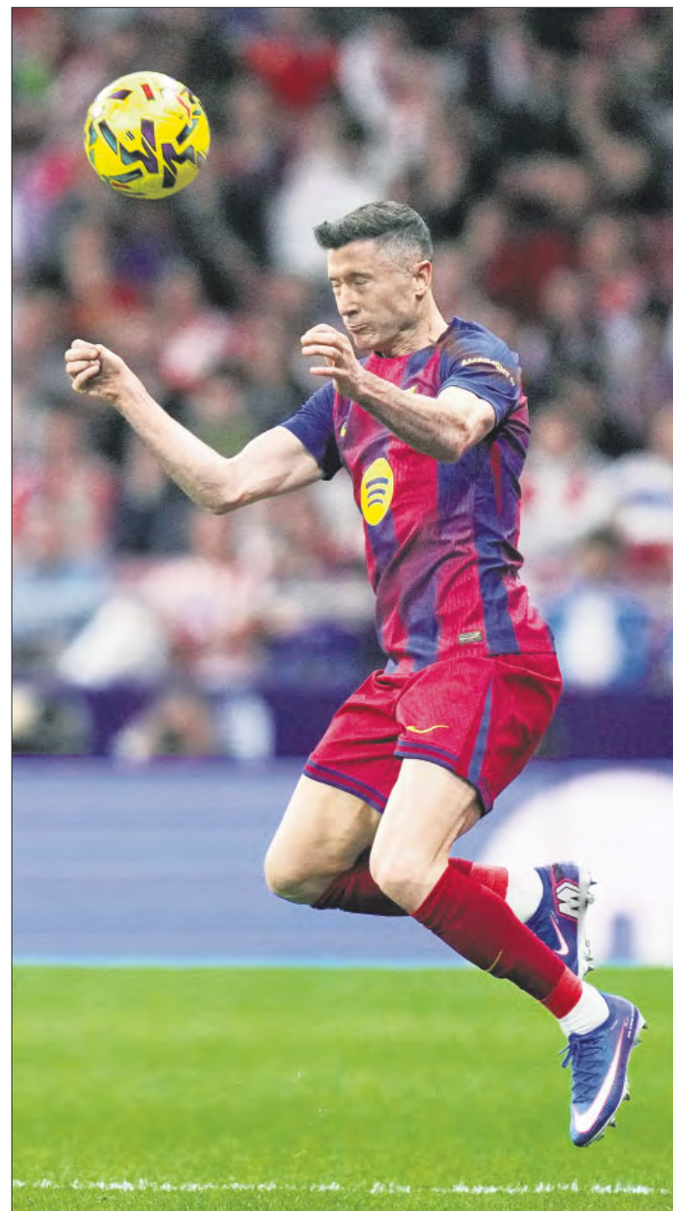
▲ En una jugada prácticamente accidental, el polaco Robert Lewandowski definió la victoria para los azulgranas en el estadio Metropolitano.

El tricolor Guillermo Ochoa, quien aún es considerado por la selección mexicana, llegó a cuatro partidos consecutivos sin jugar en la Liga de Chipre, luego de que no fue convocado el sábado por el Limalmassol, que venció 3-0 al Omonia.