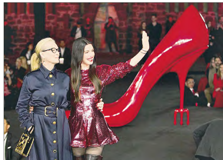
▲ Las actrices Meryl Streep (izquierda) y Anne Hathaway durante la presentación en México, de la película El diablo viste a la moda 2.

La aclamada artista, ganadora del Oscar en tres ocasiones, consideró en una entrevista a un medio local que “México ha dejado atrás a Estados Unidos teniendo una Presidenta mujer. Aunque no tiene que ver con el género, es genial para las niñas pequeñas saber que cualquiera en la familia puede ser un líder, interpretar su rol con honor y buen sentido, que es lo que queremos de nuestros líderes”, aseveró durante su presencia aquí para presentar la cinta El diablo viste a la moda 2 .