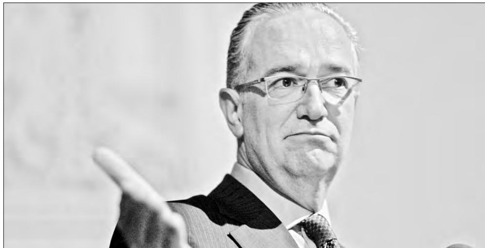
▲ Posible fallo de la Corte facultaría a la UIF para analizar información bancaria de un

Twitter: @cafevega cfvmexico_sa@hotmail.com