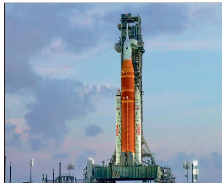
▲ El hidalguense enfatizó que la misión representa un avance en la aspiración colectiva por alcanzar nuevos horizontes.

El lanzamiento se realizó el 1 de abril de 2026 desde el Centro Espacial Kennedy, en Florida. Esta misión de 10 días traslada a cuatro astronautas con el objetivo de validar el funcionamiento del cohete SLS y la nave Orión con tripulación, garantizando la seguridad operativa para futuras expediciones. El equipo incluye a la primera mujer en participar en una trayectoria hacia la Luna.