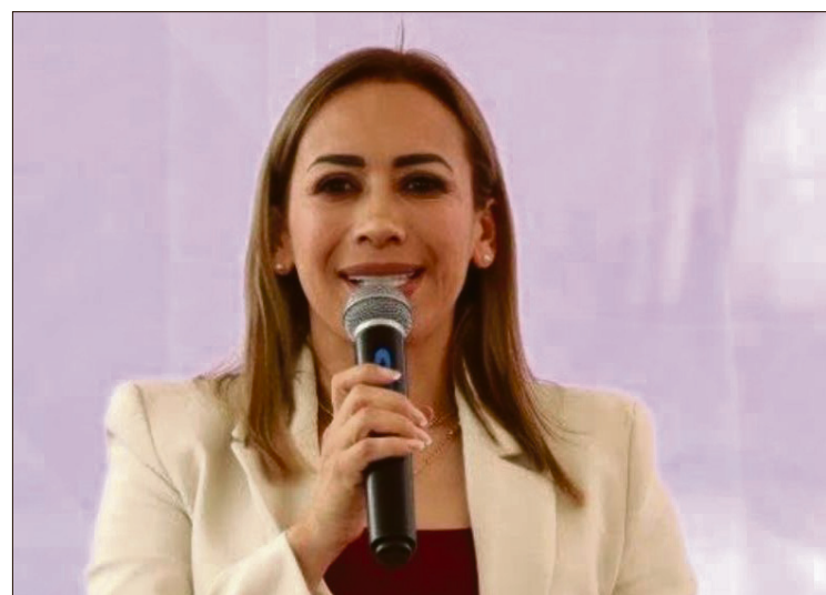
Universidad Nacional Rosario Castellanos para la zona de Tula. Pero, de concretarse la llamada

Incluso, cuando la mandataria federal visitó Tula, el 4 de marzo de 2024, como candidata presidencial, comprometió una