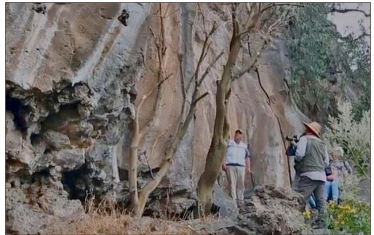
▲ Los hallazgos tuvieron lugar en el marco de los trabajos de salvamento arqueológico que realiza el INAH sobre el trazo del tren de pasajeros hacia Querétaro.

En el segundo acantilado, cercano al río Tula, el 15 de mayo de 2025 se registraron figuras, entre ellas: un venado (que da nombre al sitio); una figura con colmillos, antenas, pechera y anteojeras similares a