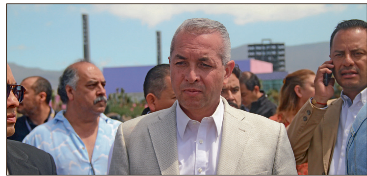
▲ El exalcalde ha sido visto en distintas ocasiones cuando acude a la Procuraduría General de Justicia.

La mayor parte del daño patrimonial por 23.5 millones de pesos co-