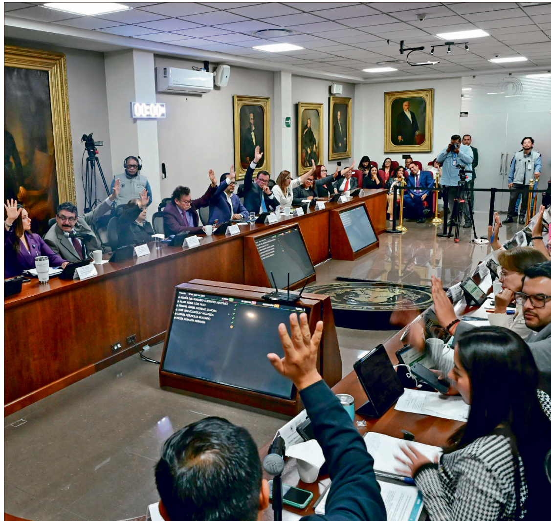
▲ La votación quedó con 25 a favor de los grupos parlamentarios de Morena, Nueva Alianza, Verde Ecologista, Movimiento Ciudadano, PT y PRD.