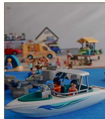
▲ La convocatoria integra un catálogo diverso diseñado para diferentes rangos de edad y preferencias.

Como referencia, durante el ejercicio 2025, el gobierno municipal erogó un total de 208 mil 104 pesos para la realización de la Feria Infantil Transformando Sueños, la cual tuvo lugar el 26