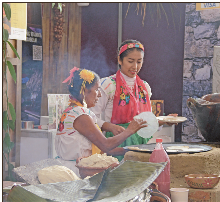
▲ La participación del estado se dará durante la semana denominada El corazón del sabor, del 25 al 30 de junio.

El complejo del Campo Marte ofrecerá una experiencia integral