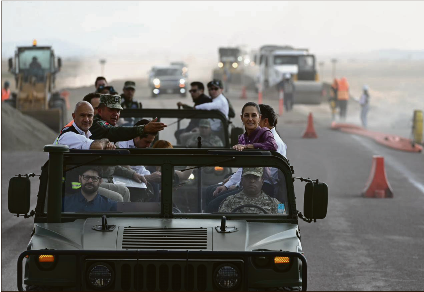
▲ La presidenta de México, Claudia Sheinbaum Pardo, visitó el municipio de Villa de Tezontepec en donde, acompañada del gobernador, Julio Menchaca Salazar, supervisó las obras del tren México-Pachuca.

SÁBADO 25 DE ABRIL DE 2026 HIDALGO // AÑO 5 NÚMERO 1771 // Precio 10 pesos