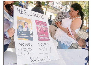
▲ El Tribunal de Arbitraje emitirá un resultado sobre si se valida o no la toma de nota.

Indicó que los sindicalizados deben comprobar la realización de asambleas, la emisión de una convocatoria, el cumplimiento de los requisitos con base en sus propios estatutos, la conformación de su comité electoral, entre otros.