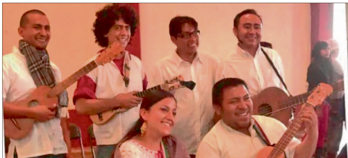
▲ La propuesta busca entrelazar la sonoridad del café y la tierra con las expresiones gráficas que se exhiben en el recinto.

La propuesta busca entrelazar la sonoridad del café y la tierra con las expresiones gráficas que se exhiben en el recinto, lo que ofrecerá al público una inmer-