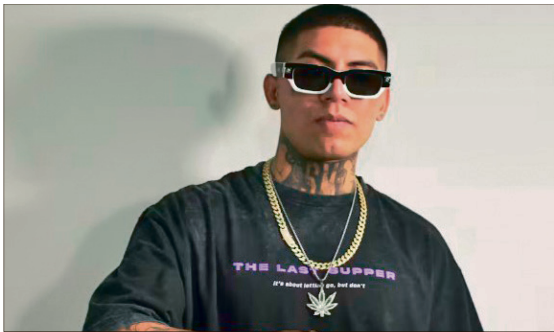
▲ Sus primeros pasos en la música surgieron al escribir canciones basadas en historias reales.

Explicó que, pese a tener una gira de 26 fechas y una visa de trabajo preaprobada, le fue negada la visa de turista, lo que impidió