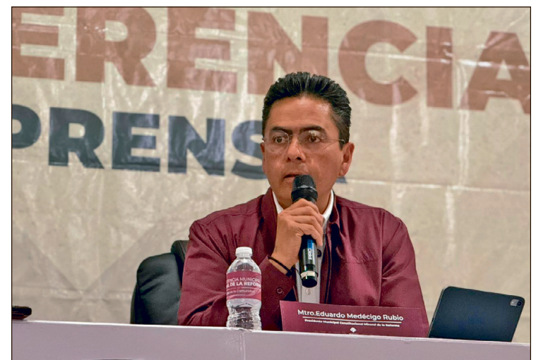
▲ El presidente municipal indicó que los cambios podrían concretarse en los próximos días.

Medécigo comunicó que su administración revisa cuántas plazas adicionales podrían abrirse,