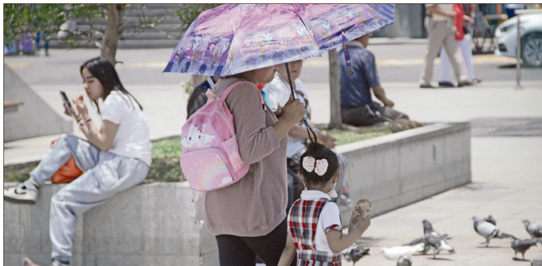
◀ Los hechos marcan el inicio de la vigilancia intensiva por la temporada de calor.

Los pacientes son un hombre y una mujer, quienes requirieron asistencia en unidades de salud tras presentar lesiones en la piel