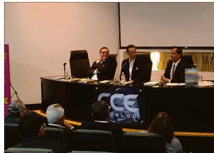
▲ Presentan el libro México es taurino , en las instalaciones del Consejo Coordinador Empresarial (CCEH).

En defensa de la actividad detallan que no responde a agendas políticas ni a visiones coyunturales, sino a una tradición viva de más de medio siglo que ha dado identidad, arraigo y sustento a varias generaciones.