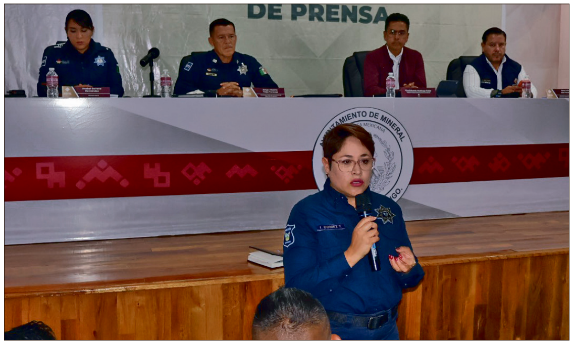
▲ Las autoridades señalaron que este periodo forma parte de los meses con mayor incidencia.

las detenciones se concentraron en Paseos de Chavarría, Privadas de Don Pablo y Rinconadas de Los Angeles.