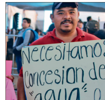
▲ Afectados exigieron la perforación del Pozo 2 en la comunidad de Matías Rodríguez.

Ante esta situación, los manifestantes aprovecharon el evento presidencial para solicitar la in-