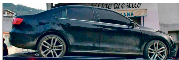
▲ Se decomisaron 766 dosis de marihuana y crystal listas para su distribución.

Además, dio a conocer que las líneas 089 y 911 están disponibles para un uso responsable y una atención oportuna.