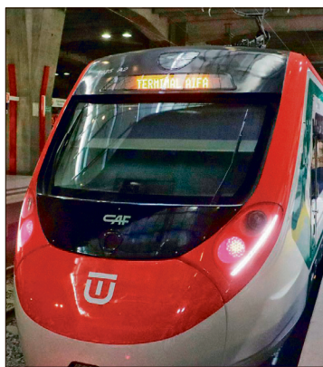
▲ La ceremonia fue encabezada por la presidenta Claudia Sheinbaum Pardo, acompañada por el gobernador de Hidalgo, Julio Menchaca Salazar; la gobernadora del Estado de México, Delfina Gómez Álvarez; y la jefa de Gobierno de la capital, Clara Brugada.

Subrayó que el nombramiento del tren en honor a Felipe Ángeles