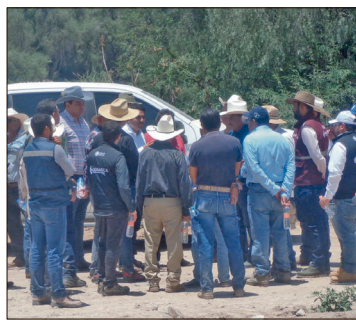
▲ Efraín Morales López, director general de la Conagua, señaló que regresará el 15 de mayo para verificar que se hayan cumplido los tiempos establecidos.

Campesinos reclamaron retrasos en las obras del canal Tlamaco-Juandhó; autoridad reconoce problemas técnicos y contractuales