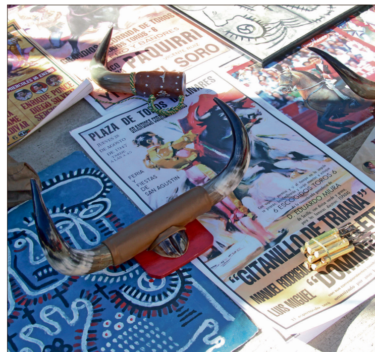
▲ La iniciativa para prohibir estos eventos avanza en el Congreso sin foros ni consulta a pueblos indígenas.

Informó que apenas este mes se confirmó quiénes participarían en los foros, pero la consulta a pueblos y comunidades indígenas donde se realizan corridas de toros aún no iniciaba; no obstante, el proyecto deberá someterse a votación de los integrantes de la Comisión de Legislación y Puntos Constitucionales para cumplir con el plazo del promovente.