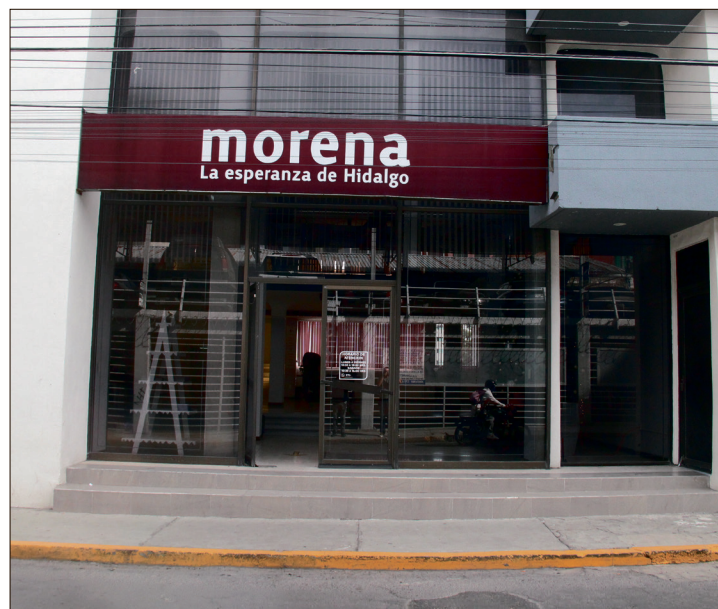
▲ Dirigencia en Hidalgo señala que aspirantes deberán pasar filtros internos; aún no hay reglas definidas.

Sobre una supuesta designación de coordinadores municipales por unidad, el presidente estatal de Morena desmintió tales versiones, asegurando que “aún no hay nada” definido en ese rubro.