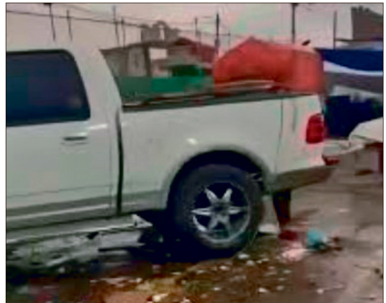
▲ La menor, de 14 años, falleció a consecuencia de las lesiones sufridas en un accidente ocurrido recientemente en la colonia Guadalupe.

Por tal motivo, la marcha del 18 de abril representa un llamado a las instituciones de procuración de justicia para garantizar que el caso no quede impune y se finquen responsabilidades conforme a la ley.