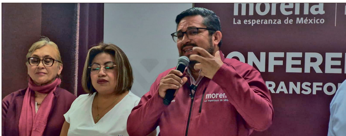
“QUEREMOS ENTRAR A TODOS LOS ESQUEMAS DE AUSTRERIDAD”: RICO