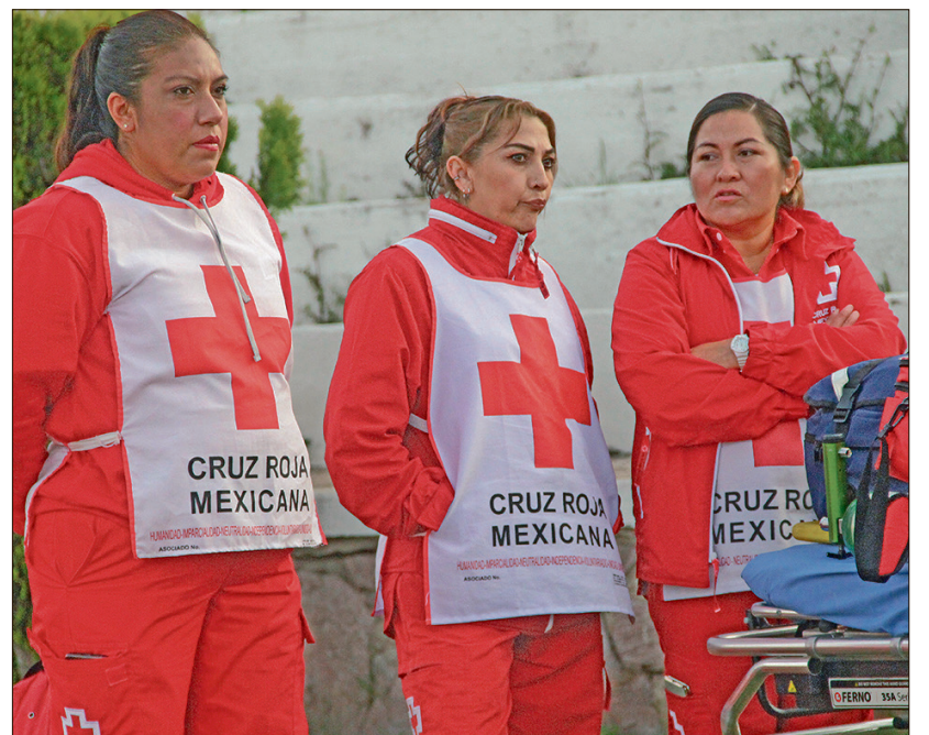
▲ En 2025 se brindaron más de 17 mil servicios de ambulancia gratuitos. La colecta busca fortalecer la capacidad de respuesta en 14 delegaciones.