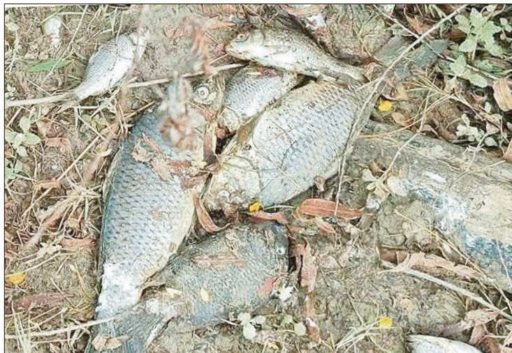
◀ Autoridades prohibieron la captura, venta y consumo de peces como medida preventiva.