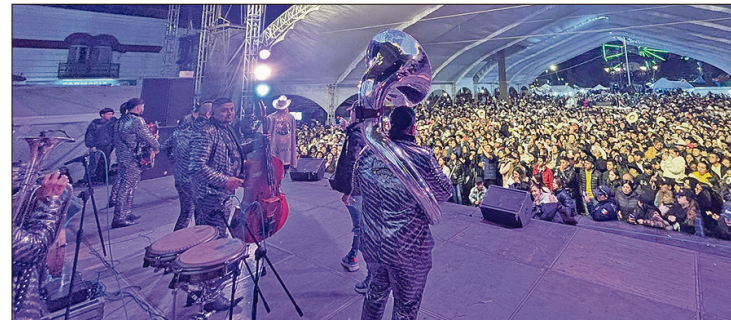
▲ En conferencia de prensa, las autoridades informaron que para esta edición la festividad no fue concesionada, por lo que el ayuntamiento asumirá la organización directa.

El 8 de mayo actuarán Los Primos de Durango, el 9 se llevará a cabo el 14° Encuentro de Huapango con La Herencia Juvenil y el día 10 se presentarán Los Cortés y