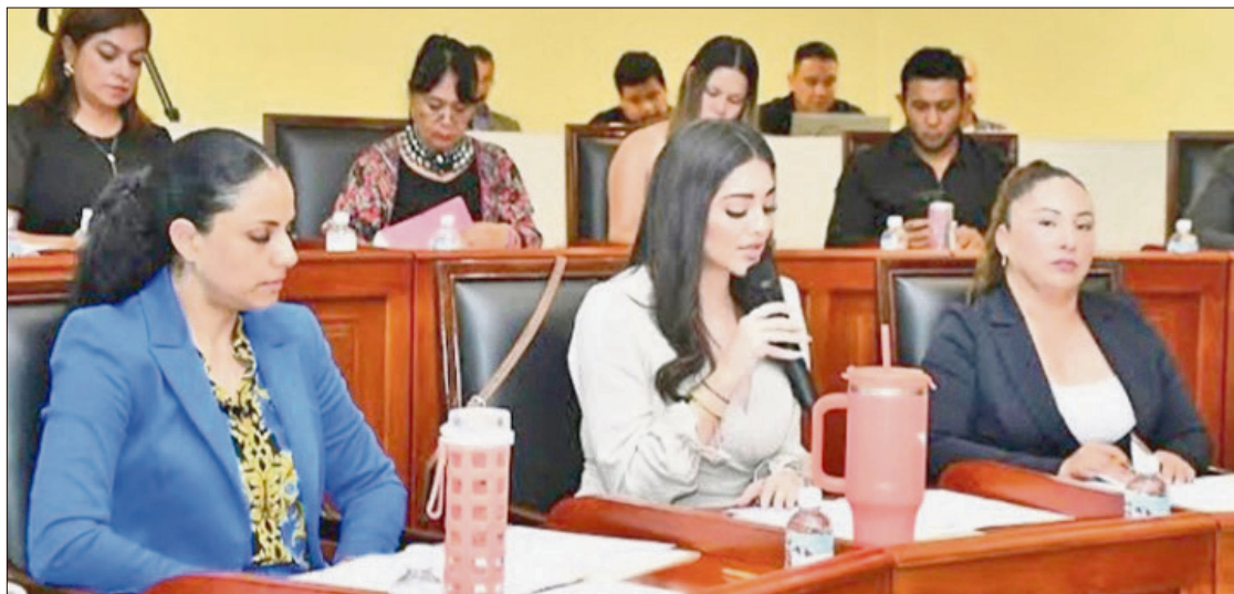
▲ Documentos oficiales de la tesorería municipal revelan que, lejos de la austeridad, los integrantes del Cabildo aseguraron beneficios económicos extraordinarios al cierre del ejercicio anterior.

da por la propia asamblea, cobra especial relevancia tras los señalamientos realizados desde la administración federal. Durante la conferencia matutina del pasado 12 de marzo, se reveló que Tulancingo forma parte de la lista de las 29 demarcaciones en México con mayor número de regidores, un esquema que la reforma electoral federal pretende dismantlar para eficientar el gasto público.