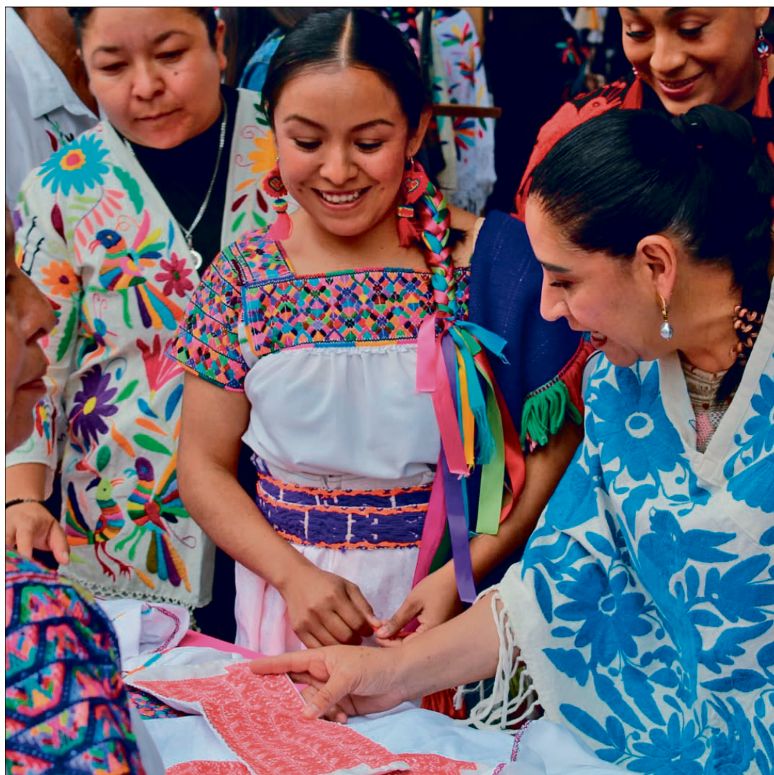
▲ Con “México borda en Tenango de Doria”, el municipio se convirtió en el epicentro de un diálogo cultural.

Tenango de Doria fue uno de los municipios más afectados por la ferocidad de la vaguada mon-