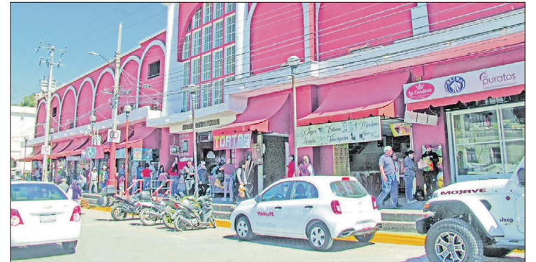
▲ Para acceder al recurso económico se debe presentar un proyecto ante la Secretaría de Desarrollo Económico.

Para acceder al recurso económico se debe presentar un proyecto ante la Secretaría de Desarrollo Económico en donde se contemple la rehabilitación parcial a fin de que se fortalezca su desarrollo comercial, la economía local, el abasto popular, la seguridad alimentaria,